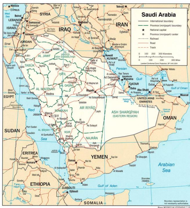
MAPA 1: Arabia Saudí

Desde que en 1932 se creara el Reino de Arabia Saudí, su estabilidad y sobre todo su identidad ha estado centrada en tres pactos que se encuentran enormemente relacionados entre sí. El primer lugar, desde el punto de vista económico y social hemos asistido a un acuerdo entre el Reino de Arabia Saudí y su población por el cual gracias a las rentas obtenida por la explotación de los hidrocarburos los saudíes han gozado de un nivel de bienestar que conllevaba el no cuestionamiento del sistema político. En segundo lugar, la familia Al Saud y los wahabíes han establecido una relación de interés mutuo por la cual los ulemas predicaban su doctrina de forma casi hegemónica a cambio de legitimar la actuación del reino. En tercer y último lugar debemos destacar la relación entre el Gobierno de Riad y las potencias occidentales. Así, a cambio de garantizar en los mercados internacionales –sobre todo en el seno de la OPEP- unos precios de la energía estables, Arabia Saudí ha podido disfrutar de una paz regional imprescindible para desarrollar su proyecto nacional. Veamos de forma más pormenorizada estos tres pactos y como en los últimos años se han quebrado.