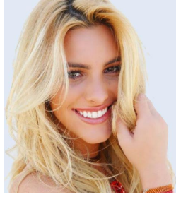
Ilustración 3: Lele Pons