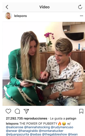
Ilustración 9: Video de Instagram de Lele Pons

Por esto se puede decir que Lele Pons es una influencer que cumple con la condición de la creación de contenido, sobre todo contenido de entretenimiento ya que su especialidad consiste en subir videos tanto a Instagram como a Youtube, que tratan de hacer reír a la gente, lo que le ha acabado convirtiendo en una de las personas más influyentes de los últimos años y sus videos ya sobrepasan los 27 millones de reproducciones en Instagram: