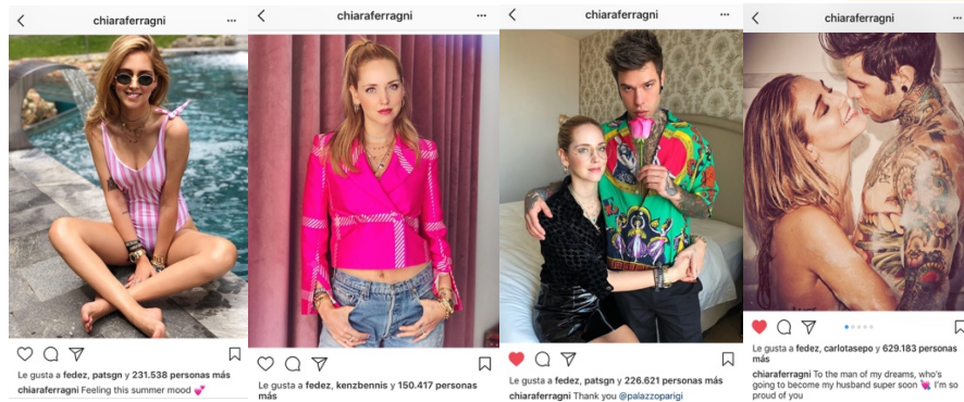
Ilustración 12: Posts diarios de Chiara Ferragni en su perfil de Instagram