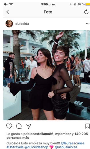
Fuente 5: Perfil de Twitter de @Dulceida. Ilustración 5: Dulceida y Laura Escanes Consultado el 4 de junio de 2018