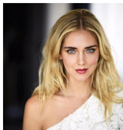
Ilustración 4: Chiara Ferragni