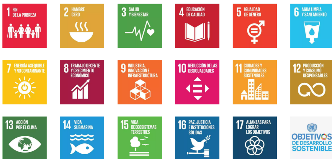
Ilustración 3: Objetivos de Desarrollo Sostenible.

Esta Agenda se compone de 17 objetivos, que a su vez están formados por 169 metas que sirven de guía para conseguir reducir de los problemas económicos, sociales y ambientales con una fecha límite: 2030. En definitiva, se elaboró esta agenda con objetivo de que toda la población, individuos, empresas, instituciones tanto del sector público como privado participen, se comprometan y asuman estos objetivos y metas como propios para conseguir un mundo sostenible para todos (Sánchez et al., 2018).