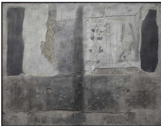
Imagen 10. Superposition de matière grise , de Antoni Tàpies. Óleo y cemento sobre lienzo encolado en madera, 1961. Museo Nacional Centro de Arte Reina Sofía, Madrid.