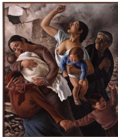
Imagen 6. Madrid 1937 (Aviones negros) , de Horacio Ferrer. Óleo sobre lienzo, 1937. Museo Nacional Centro de Arte Reina Sofía. Madrid

La participación de los países europeos en la guerra que estaba teniendo lugar en España fue notable desde los albores del conflicto; no obstante, cabe señalar, además del respaldo material, el apoyo moral que Italia y Alemania ofrecieron al bando nacional, especialmente al final de la guerra, con el reconocimiento oficial del régimen de Franco. Este respaldo moral e ideológico resultó determinante a la hora de definir las líneas de acción de la política exterior franquista durante los primeros años del régimen.