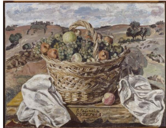
Imagen 8. Cesta en el campo , de Benjamín Palencia. Óleo sobre lienzo, 1943. Museo Nacional Centro de Arte Reina Sofía, Madrid.

Ante tal panorama, las artes debieron reiniciar su andadura recurriendo a la tradición anterior, siempre bajo una censura que limitaba la técnica y la temática. En la primera mitad de los años cuarenta, aquellos artistas que no habían abandonado el país y que anteriormente destacaban por su creatividad se veían ahora desarrollando un estilo costumbrista, tal y como se puede observar en las imágenes 7 y 8. Así, el paisaje