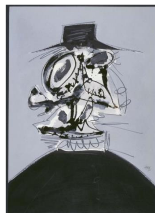
Imagen 12. Retrato imaginario de Felipe II , de Antonio Saura. Técnica mixta sobre papel, 1974. Museo Nacional Centro de Arte Reina Sofía, Madrid.

En pocas palabras, la posibilidad de españolizar el arte informalista, de interpretarlo como arte moderno netamente español, permitió respaldar la despolitización y desideologización aparente del arte abstracto. Así, el régimen pudo utilizar, de forma coherente y en línea con los valores franquistas de tradición y