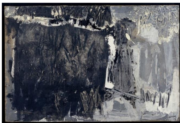
Imagen 11. Pintura , de Rafael Canogar. Técnica mixta sobre lienzo, 1957. Museo Nacional Centro de Arte Reina Sofía, Madrid.