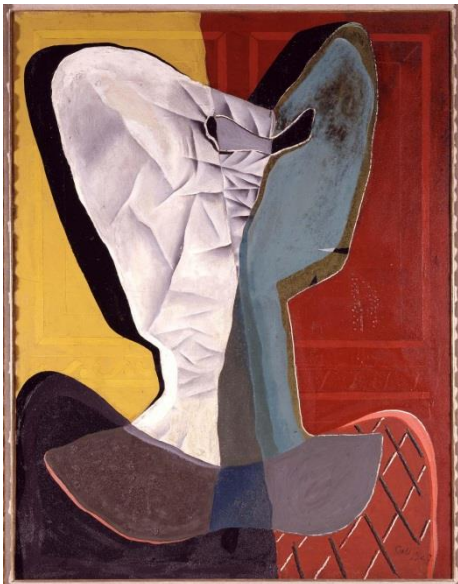
Imagen 1. Arlequín , de Salvador Dalí. Óleo sobre lienzo, 1926. Museo Nacional Centro de Arte Reina Sofía, Madrid.