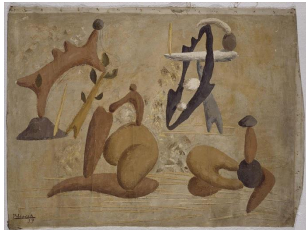
Imagen 2. Composición , de Benjamín Palencia. Óleo y arena sobre lienzo, 1933. Museo Nacional Centro de Arte Reina Sofía, Madrid.

Sin embargo, en el año 1936 comenzó un cambio del panorama artístico español que perduró a lo largo de las siguientes décadas. Si bien la Guerra Civil no supuso el cese de la producción artística, sin duda significó un cambio notable en el ámbito