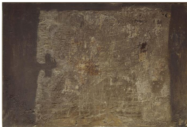
15. Pintura , de Antoni Tàpies. Técnica mixta sobre lienzo, 1955. Museo Nacional Centro de Arte Reina Sofía, Madrid.