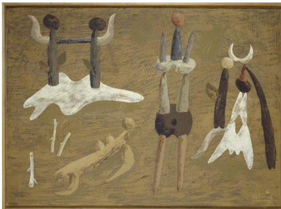
Imagen 7. Composición , de Benjamín Palencia. Óleo y arena sobre lienzo, 1933. Museo Nacional Centro de Arte Reina Sofía, Madrid.

En los años siguientes a la Guerra Civil, las autoridades del régimen cerraron el país a toda vanguardia artística e intelectual y se decidió ignorar las creaciones vanguardistas anteriores, puesto que amenazaban los valores y la estabilidad del nuevo régimen. De hecho, el régimen percibía las corrientes artísticas de preguerra como el máximo exponente de la degradación y de la degeneración de la sociedad occidental. Además, todos sus grandes representantes en territorio español, salvo excepciones puntuales, habían optado por el exilio (Fuentes, 2011, p. 185).