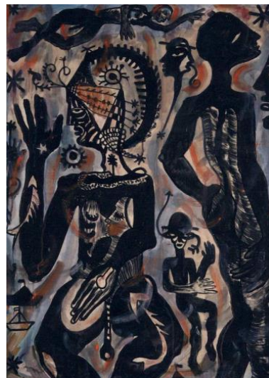
14. Composició , Joan Ponç. Técnica mixta sobre papel, 1950.