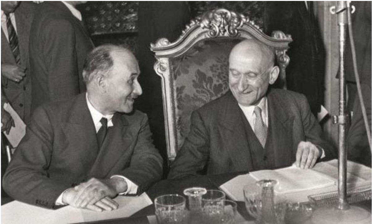
Jean Monnet y Robert Schuman.