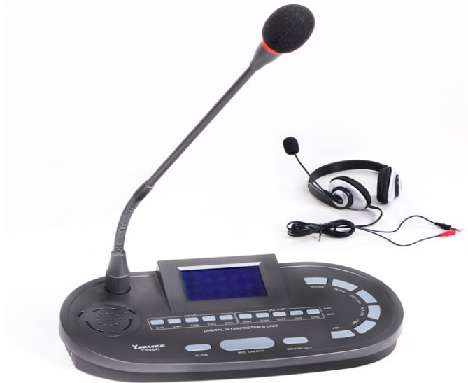
Consola de interpretación

En la consola de interpretación debe haber varios canales de entrada y de salida y debe resultar sencillo distinguir entre los selectores de entrada y de salida. Dichos selectores, en el caso de los canales de salida, consisten en botones que se pulsan, mientras que en el caso de los canales de entrada, se trata de ruedas giratorias