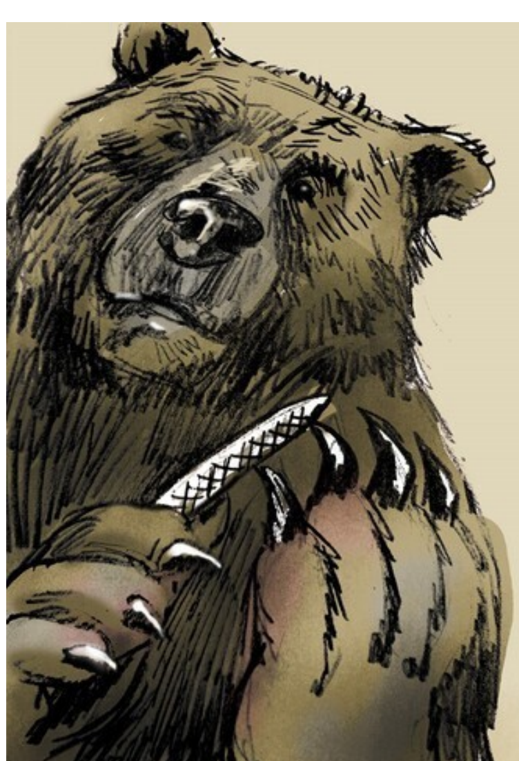
Ucrania: ¿guerra o deshonor? / ROSELL

Desde hace más de ocho años, Ucrania se ha convertido en el centro de muchas noticias internacionales. La razón de este inesperado protagonismo es el conflicto que mantiene con su vecino Rusia, que ansía incorporarla como una nueva república de su federación. Ante esta situación que es más propia del periodo de entreguerras que del siglo XXI, cabe hacerse las siguientes preguntas: por qué Ucrania es tan importante para Rusia, qué espera obtener de esta situación y, sobre todo, como puede evolucionar en las próximas semanas.