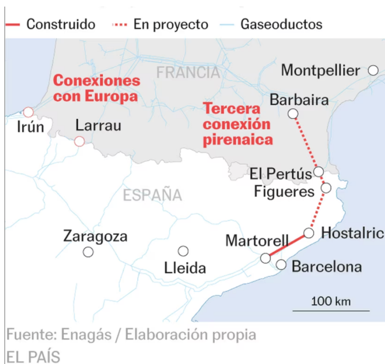
Imagen 1: Proyecto Midcat

A pesar de ese nuevo intento, en 2019 la construcción del Midcat se paralizó de nuevo, debido a que los técnicos franceses dictaminaron que el proyecto no era financieramente viable, ya que los costes de la construcción superaban en gran medida la rentabilidad de la infraestructura (Pöyry, 2017). Se estima que tras este nuevo intento de finalizar la construcción del Midcat quedan 120 kilómetros en la parte francesa y 100 en la española para terminar dicha infraestructura (Velázquez, 2022).