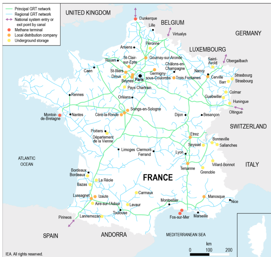
Imagen 4: Mapa de la infraestructura de gas en Francia