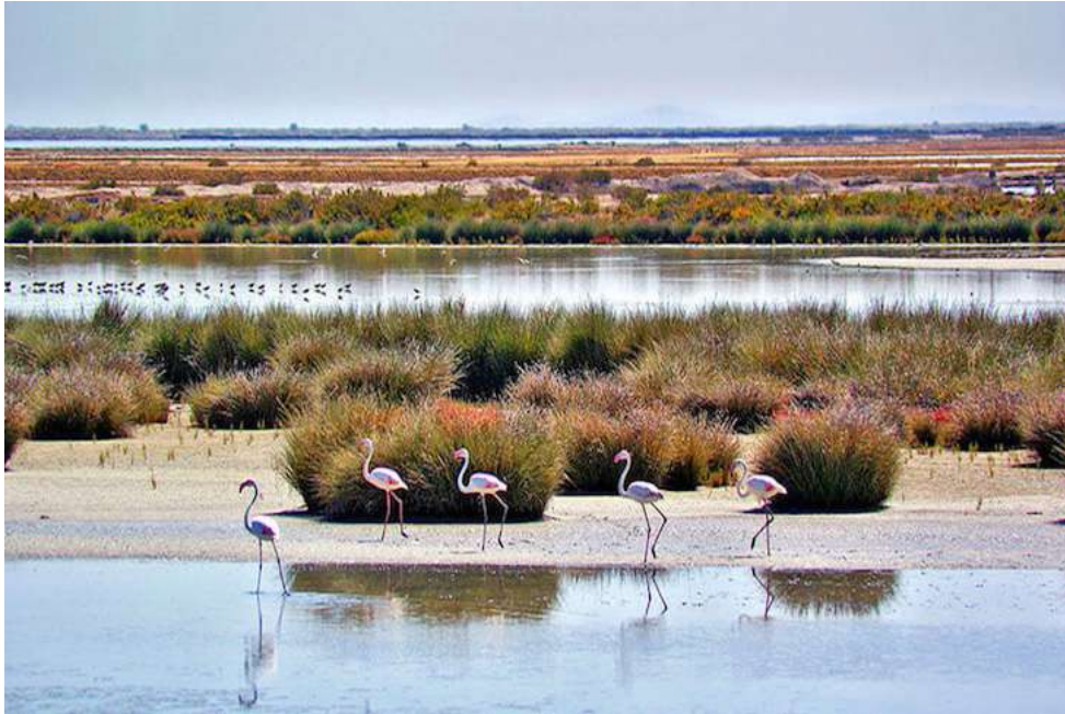
Imagenz(5): Doña Ana