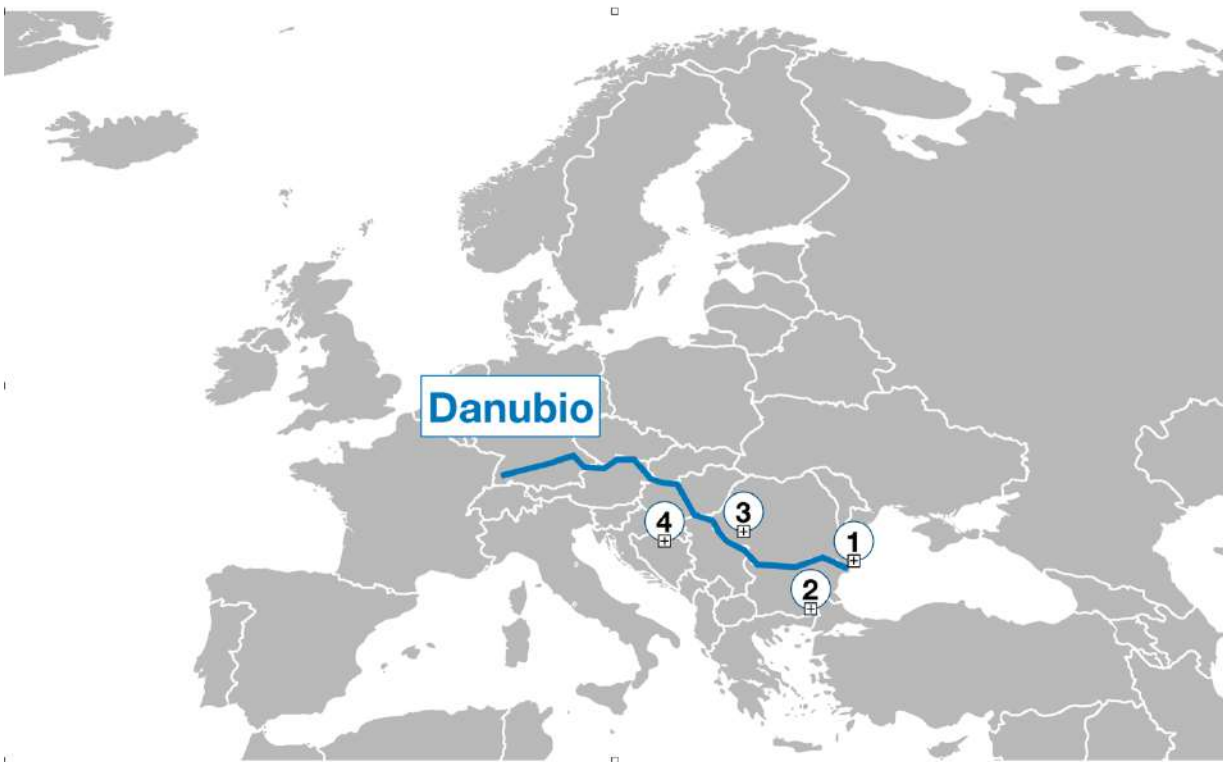
Imagen(k): Ruta de crucero río DANUBIO