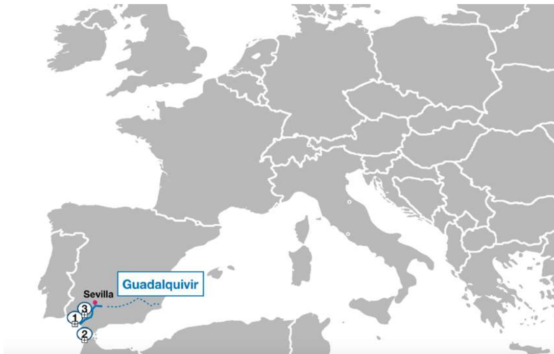
Imagen (z4): Ruta crucero río GUADALQUIVIR