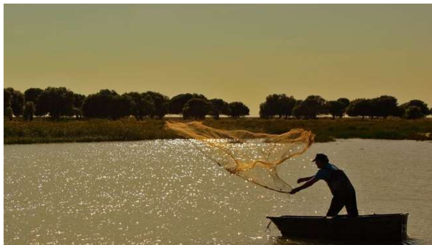
Imagen(z6): Pescador en esteros

Los esteros del Guadalquivir son lagunas artificiales diseñadas para el cultivo del pescado. Además, son declarados Reserva Ecológica dada la gran biodiversidad que albergan. Aquí, la acuicultura se realiza garantizando la conservación y la protección de aves amenazadas o protegidas que habitan en estos humedales. Está situado en un espacio natural en una de las zonas de migraciones de aves más importantes. Estos paisajes son tan espectaculares que hasta el director de Steven Spielberg decidió rodar alguna de sus películas. (45)