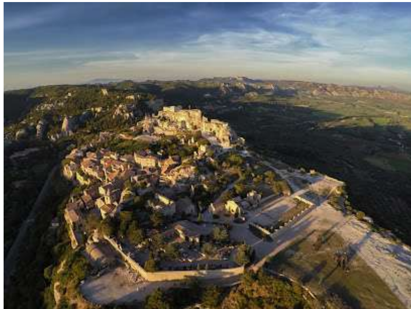
Imagen(x): Beaux de Provence

Beaux de Provence es una encantadora comuna francesa situada en la región de Provenza, Costa Azul. Su estratégica situación sobre un espolón rocoso en el corazón del macizo de los Alpilles, le valió para la clasificación de uno de los pueblos más bonitos de Francia. El pueblo alberga monumentos de alto valor cultural, como el Castillo de Baux, testimonio de la edad media, la iglesia de San Vicente y museos. Recibe casi 1,5 millones de turistas al año. (37)