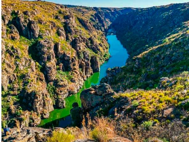
Imagen(z3): Miranda del Duero

En esta zona del Duero se suelen realizar excursiones didácticas, acompañadas por personal cualificado, como guías y biólogos, que explican los puntos de interés del recorrido. Los portugueses han dejado un Legado histórico en su casco urbano donde se pueden realizar infinidad de paseos rodeados de aire libre y naturaleza, ya que se encuentra emplazada en el parque natural do Douro Internacional. Está organizado por la sociedad Europarques, un proyecto medioambiental cofinanciado por la Unión Europea.