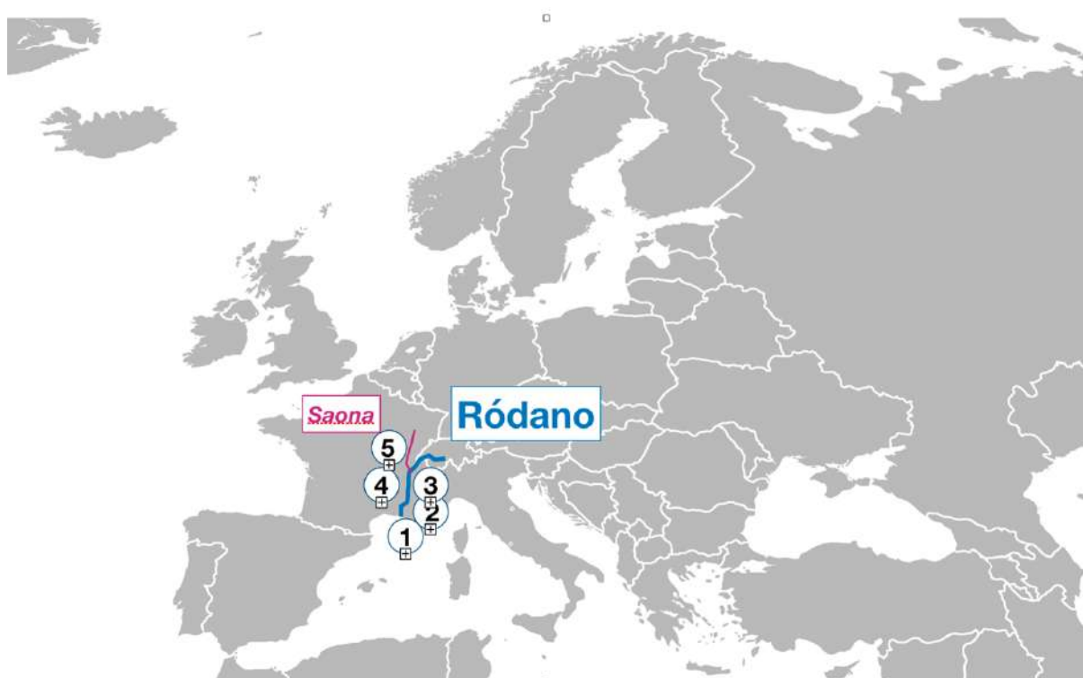
Imagen (v): Ruta de crucero río Ródano

El crucero por el Ródano es una interesante opción para pasar unas vacaciones, esta zona geográfica de Francia nos ofrece arte, la cultura, belleza en los paisajes. (35)