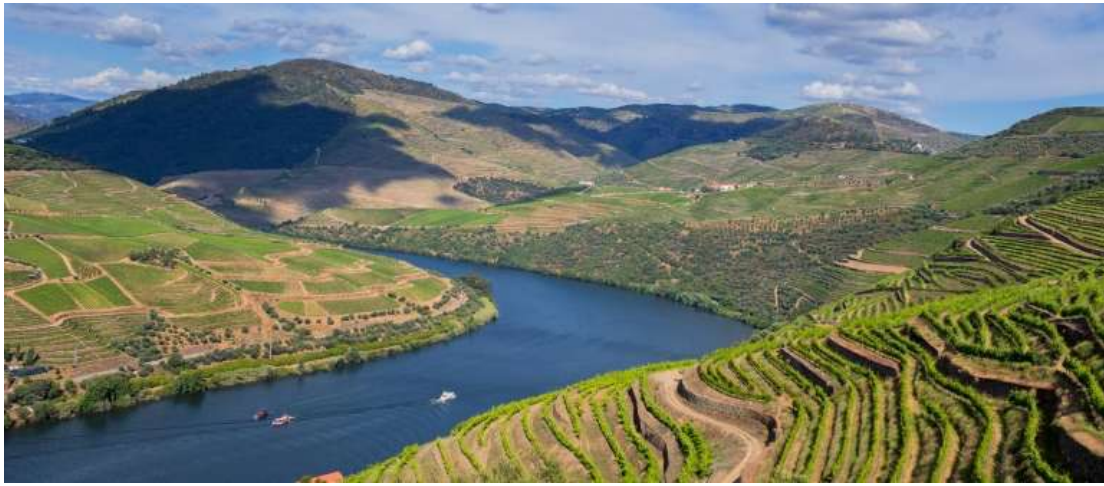
Imagen(z1): Río Piñhao