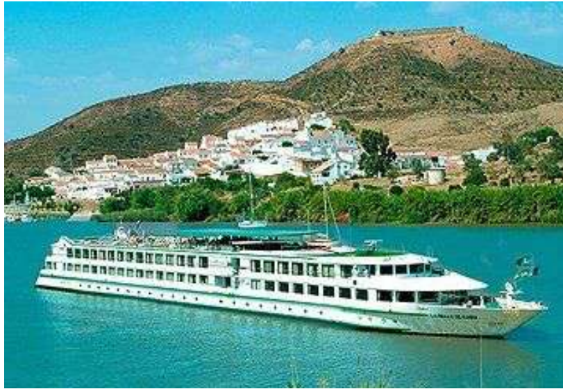
Imagen (f) : Crucero fluvial