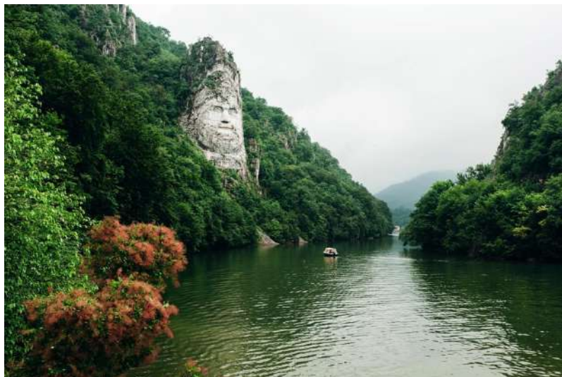
Imagen(ñ): Puertas del Hierro

En el Rio Danubio destacan las espectaculares gargantas de la Puerta de Hierro, entre Serbia y Rumania. Los cruceros navegan a través de esos desfiladeros durante el día. La mayoría de los viajeros la consideran el área más pintoresca e impresionante del Danubio.