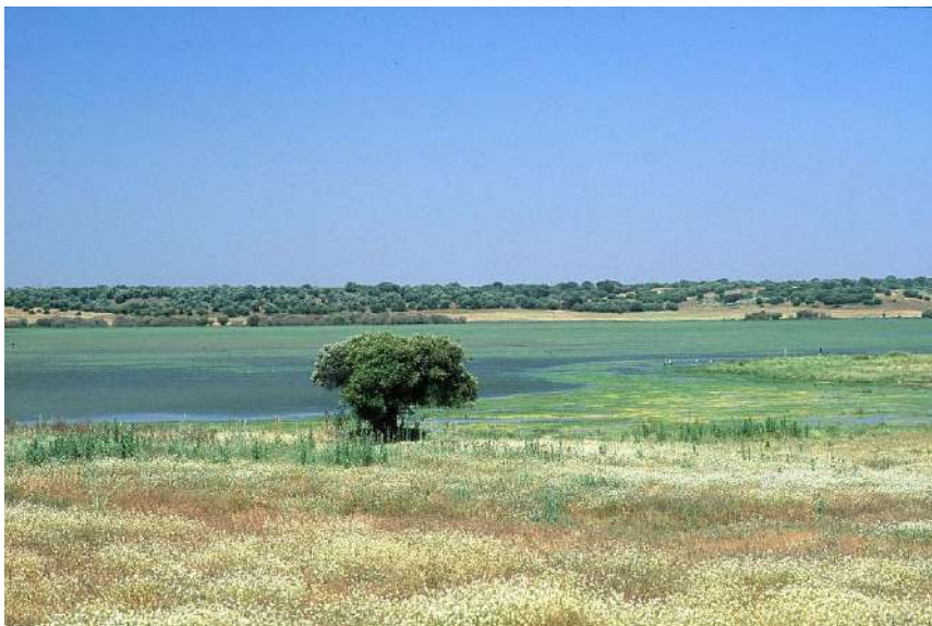
Imagen(z8): Parque natural Doña Ana

Una vez realizado el análisis de las diferentes rutas, se han tenido en cuenta los siguientes aspectos para la elección de la misma: