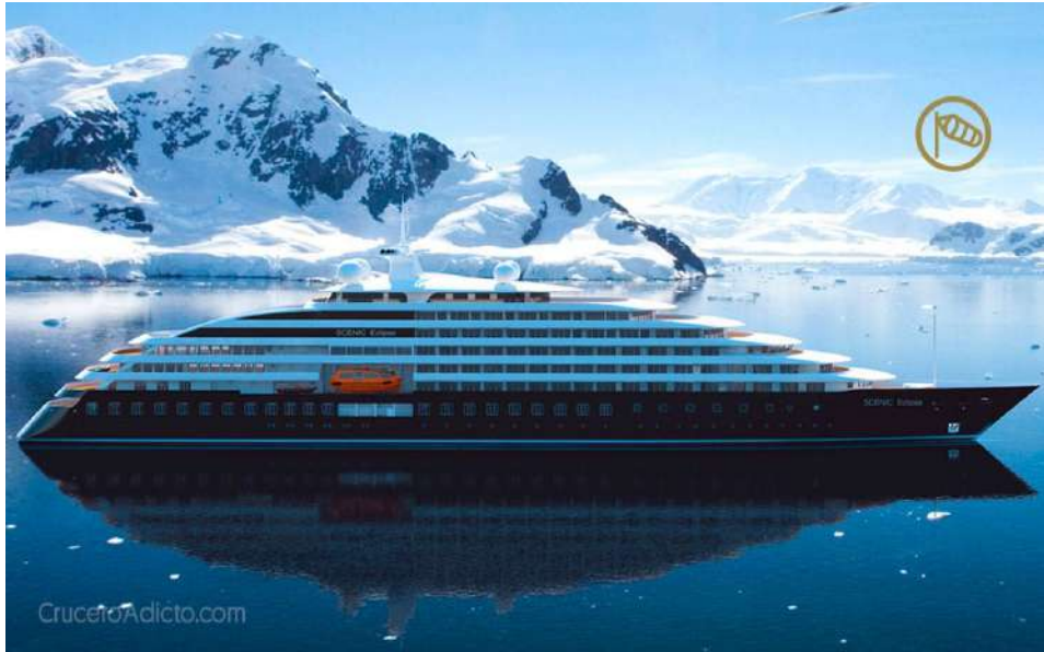
Imagen (d): Crucero de lujo