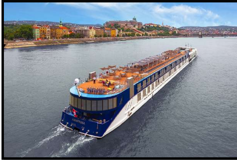
Imagen (j): Cruceros fluviales de Amawaterways

Como hemos podido ver, el mayor daño que causan los buques al medioambiente es a través del combustible.