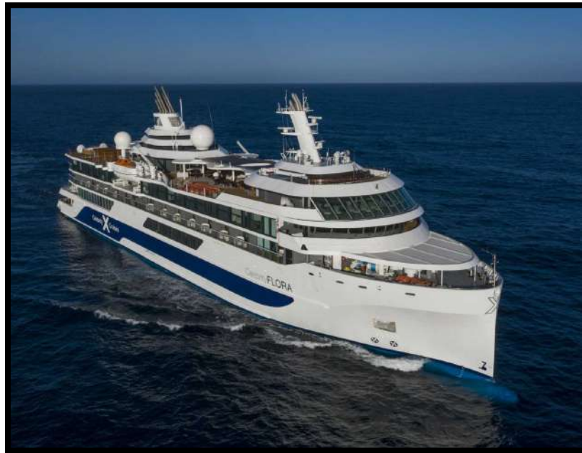
Imagen (g) : Buque Celebrity flora de Royal Cruise