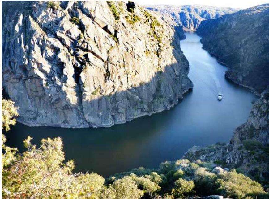
Imagen(z2): Arribes del Duero

El parque natural es uno de los rincones más vírgenes de España y está muy visitado por senderistas. (42)