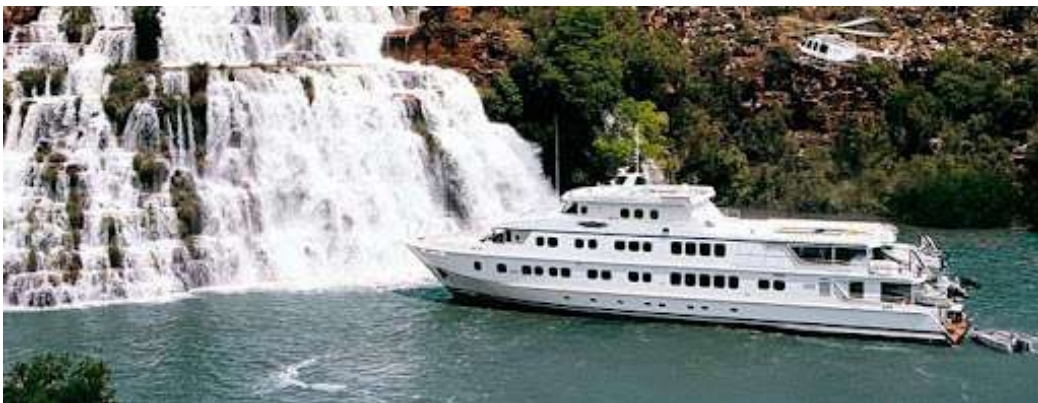
Imagen (e): Crucero de aventura