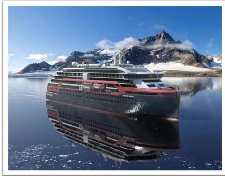
Imagen (f): Buque Roald Amundsen de Hurtigruten