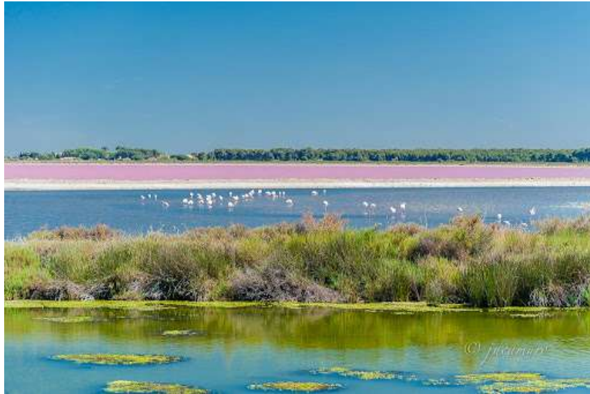
Imagen(w): Río en La Camarga