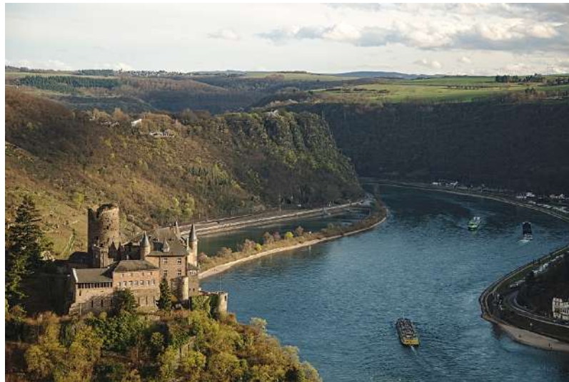
Imagen(p): Río Rin

En el río Rin, Alemania, son famosos sus paisajes montañosos, sus bosques eternos y una vegetación exuberante. Es una de las rutas por excelencia de Europa. Al viajero le llevarán a recorrerse algunas de las áreas más bonitas de este país. (34)