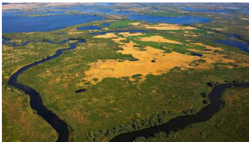
Imagen(l): Delta del Danubio

El Delta del Danubio es uno de los ecosistemas más ricos y desconocidos de Europa. A orillas del mar negro se extiende un humedal que alberga un paraíso salvaje. En la localidad de Tulcea, el río se divide en tres brazos principales, dando una extensión de 4.000 kilómetros cuadrados de marismas, islotes de juncos, y bancos de arena. Está bajo la protección medioambiental de la reserva de la Biosfera del delta del Danubio. La región es un refugio para peces y aves de todo tipo. A mediados del siglo XIX, fue elegida por la comisión Europea del Danubio, una temprana iniciativa multinacional nacida para transformar los canales del Delta en una ruta navegable.