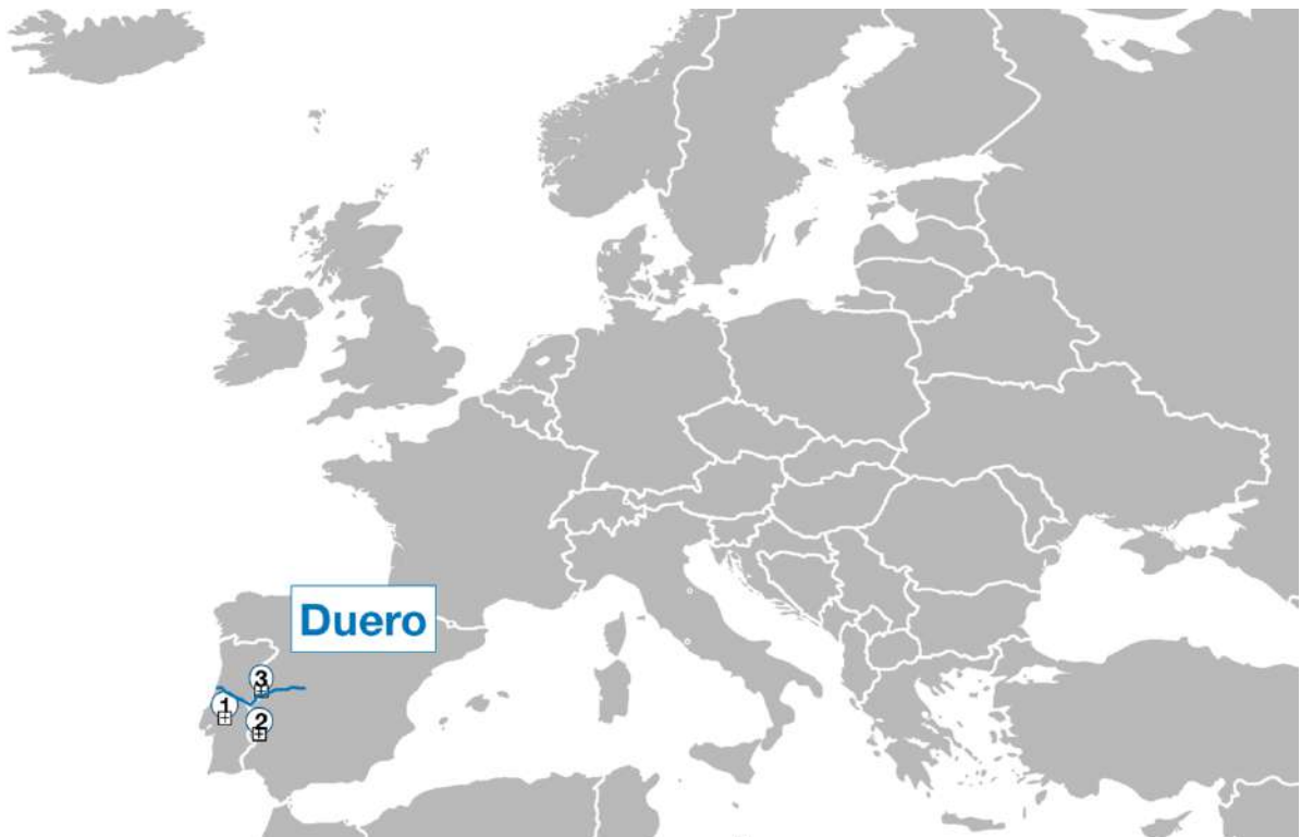
Imagen(z): Ruta de crucero Río Duero

El caudal del Duero es aprovechado para producir energía eléctrica desde hace años. A lo largo de su cauce hay numerosos embalses y presas, llamadas “saltos del Duero”. Gracias a ello, el río Duero es navegable. (41)