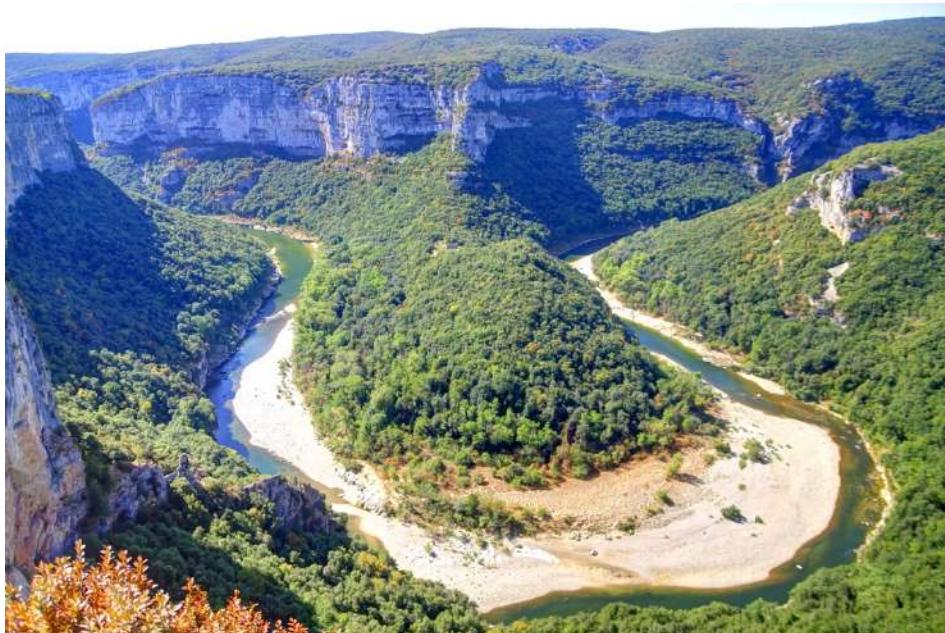
Imagen(y): Gargantas de Ardeche

Las gargantas del Ardeche son unas espectaculares gargantas talladas por el río Ardeche, un afluente del Ródano que discurre entre los departamentos de Ardeche y Gard. Cuenta con preciosos pueblos medievales y alguna de las cuevas más importantes de Francia. Las aguas del famoso río han necesitado más de cien millones de años para escavar este profundo cañón. El resultado es un inmenso desfile de escarpes calcáreos que en algún punto alcanza los 300 metros de altura, en medio de una naturaleza salvaje y preservada. (40)