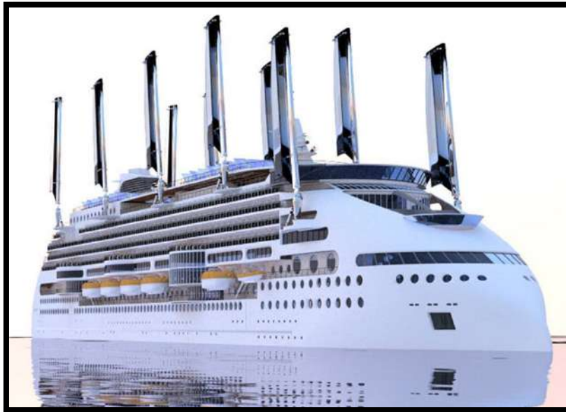
Imagen(i) : Buque Ecoship de Japan Grace