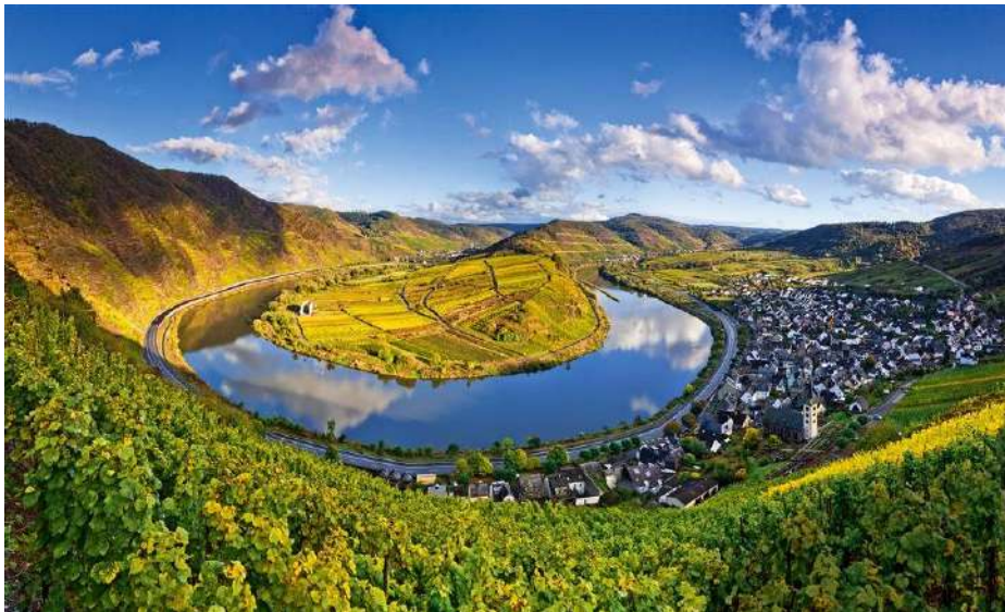
Imagen (u): Río Mosela

El río Mosela es un río de Europa, afluente izquierdo del Rin, discurre por el noreste de Francia, gira entre Trier y Koblenz a lo largo de uno de los valles fluviales más impresionantes de Alemania.