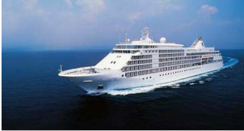
Imagen (b): Crucero convencional