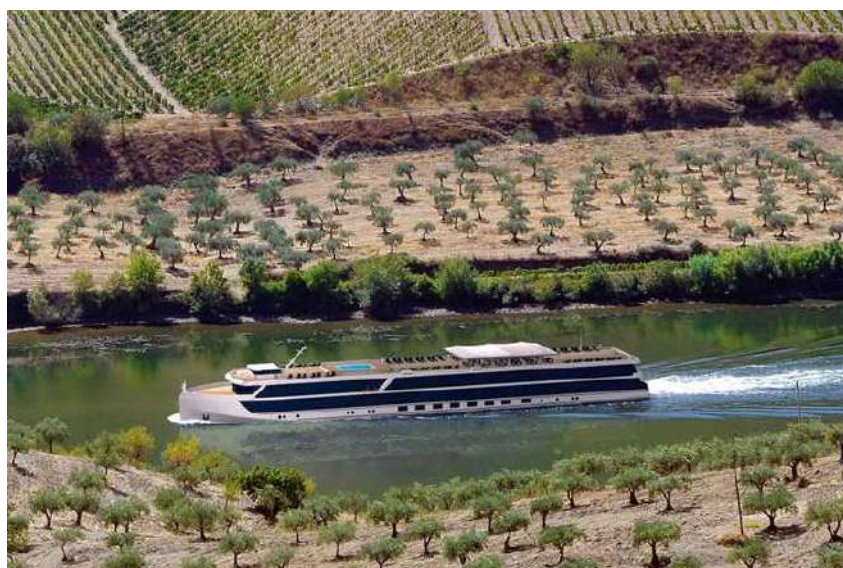
Imagen (l): Cuero Duoro Serenity

Dentro de su flota, han elegido el buque Douro Serenity como buque piloto en el desarrollo de una propulsión a base de hidrógeno como combustible del motor principal. El buque cuenta con una cubierta dotada de placas fotovoltaicas para reducir las emisiones, y tiene una propulsión dual-fuel / híbrida.