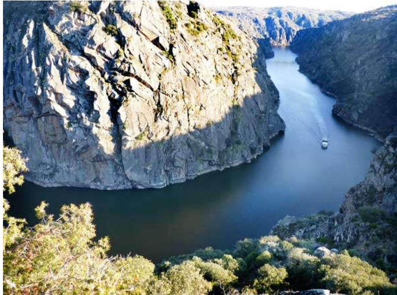
Imagen (k): Crucero por el Duero

El Douro Azul, tiene barcos que navegan por el río Duero, hasta la frontera entre Portugal y España y Oporto.