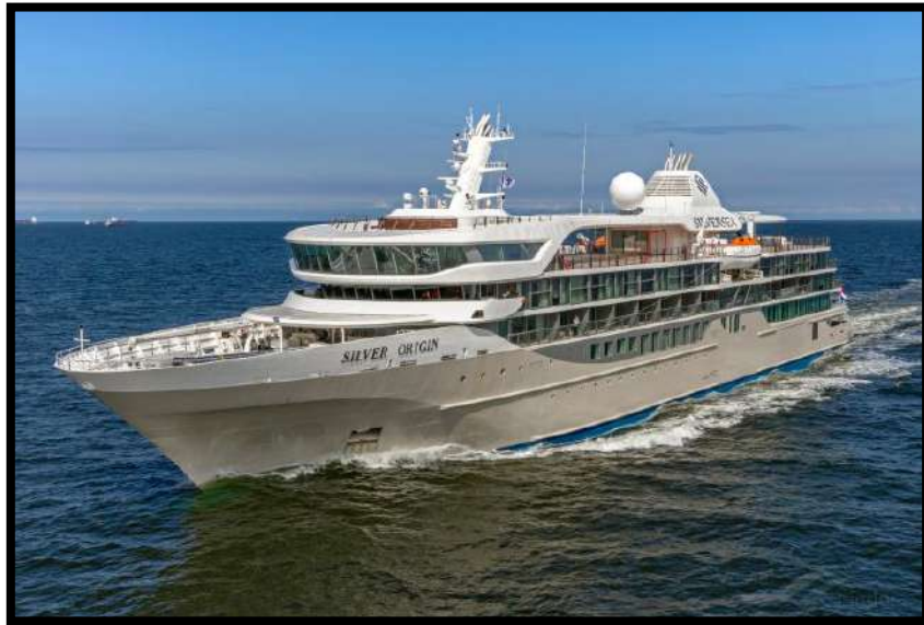
Imagen (h): Buque Silver Origin de Silver Cruises