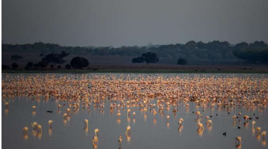
Imagen(z7): Flamencos en el parque natural

En esta reserva Natural concertada y sus alrededores, existen caminos muy apropiados para recorrer a pie, en bicicleta o a caballo y admirar la diversidad natural que contienen, su excepcionales paisajes, lagunas y canales, arrozales, aves , fauna y flora, en especial entre los meses de invierno hasta mayo. (46)