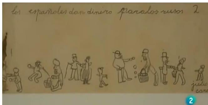
Ejemplo 2 (Otero Urtaza, 2014)

Portfolio de Evidencias: Los alumnos tendrán que juntar las evidencias recogidas para sus proyectos, dentro de un archivador propio y será entregado al profesor al finalizar cada trimestre.