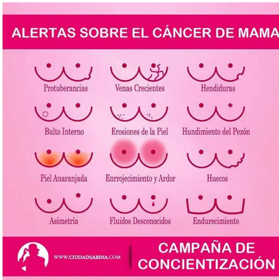
Imagen sacada de: Magnetosur. Programa de detección precoz del cáncer de mama [Internet]. España: Magnetosur; [citado 2025 Ene 23]. Disponible en: https://magnetosur.com/programa-deteccion-precoz-cancer-mama/