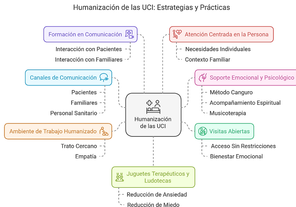
Figura 1 – Estrategias proyecto HU-CI. Elaboración propia a partir de (Evelyn Kvande et al., 2021; Oliveira Santos et al., 2024)

Por otro lado, existen artículos que hablan de cómo la inclusión de juegos, especialmente en unidades pediátricas, favorece la aproximación a los niños para que hablen de sus sentimientos y se comuniquen con mayor eficacia (Sales Cardoso et al., 2021). Así como la musicoterapia, una actividad cada vez llevada a cabo de manera individual por más enfermeras, permite una disminución del nivel de dolor en pacientes (Cardoso et al., 2017).