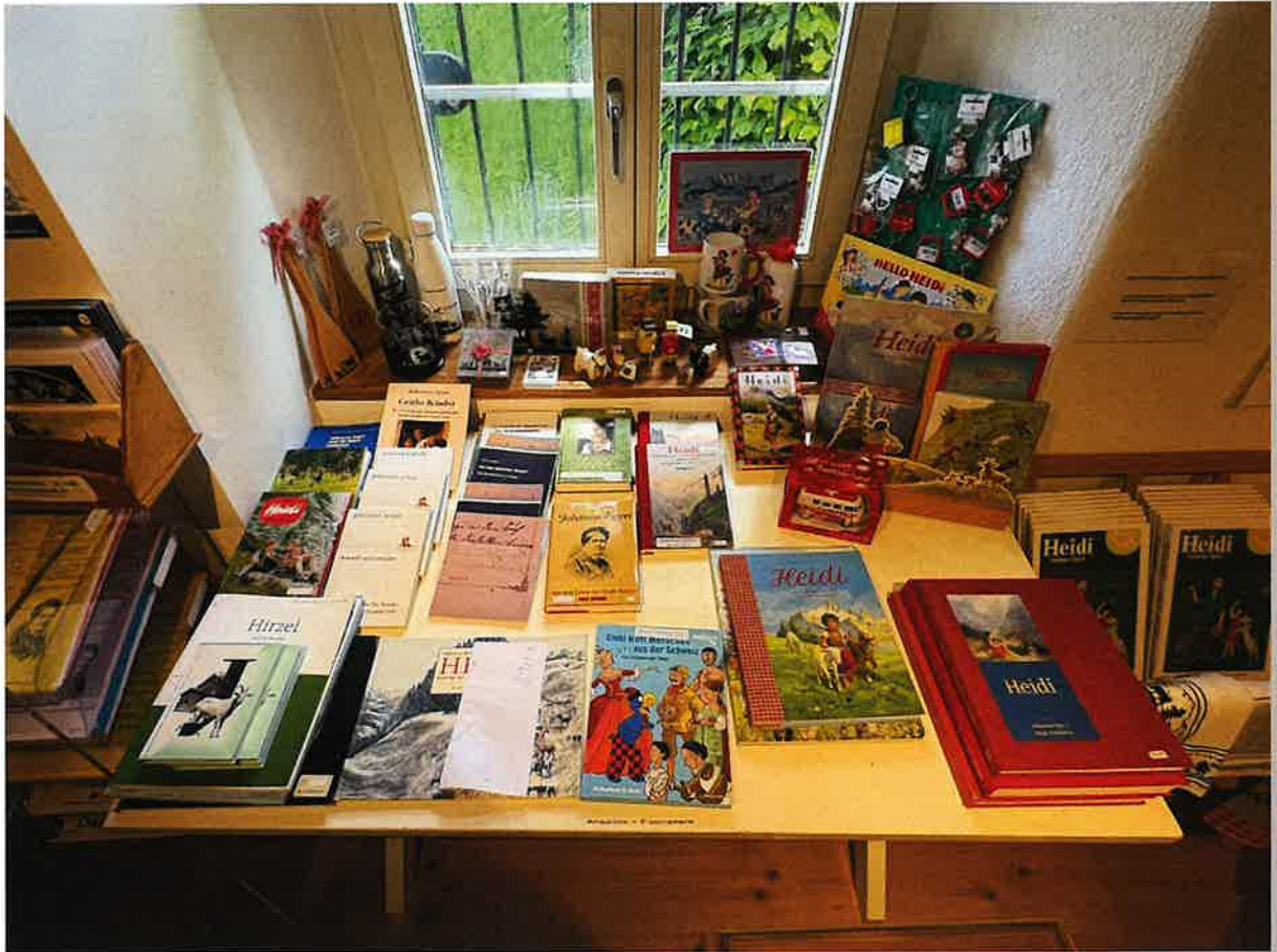
Casa museo de Johanna Spiry en Zurich (Suiza).