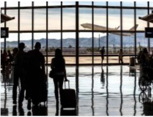
América first o América, best?