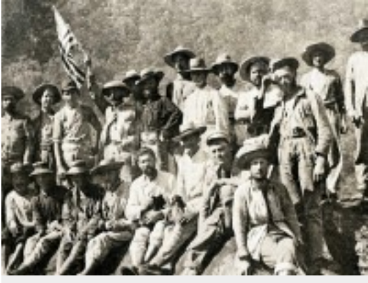
El corazón de las tinieblas americano