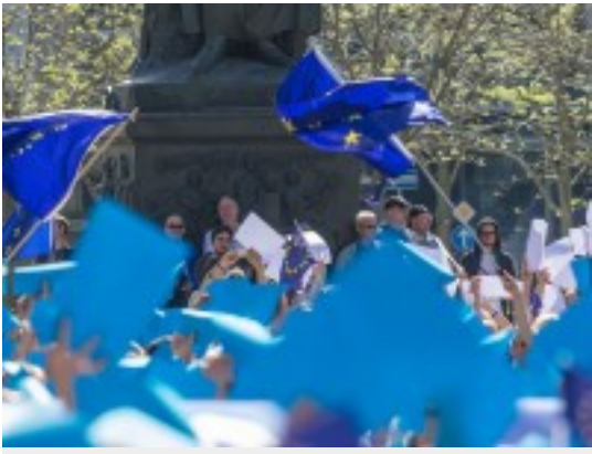
De circos y domadores: la Unión Europea y los Estados Unidos