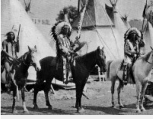
Indian removal: cartografía de la “gran mudanza” india