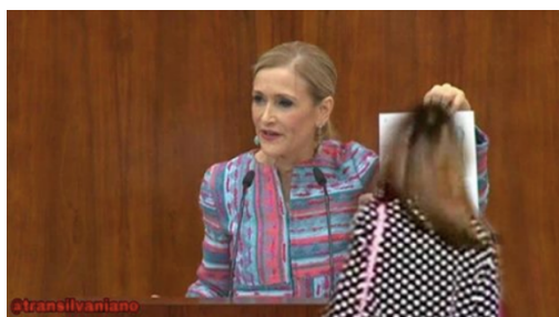
Imagen 2: Ejemplo: «exploitable» de Letizia tapando a Cifuentes.

Lo mismo sucede en la imagen 3 (FCINCO, 2018) con el gol en los últimos minutos de Cristiano Ronaldo que hizo que el Real Madrid pasase a semifinales 41 de la Champions League. Sucesos cuya idoneidad en la cultura popular y política se combinan para dar lugar a estos memes que se dejaron ver en varias redes sociales.