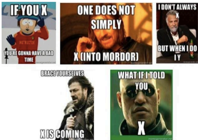
Imagen (OIC, s.f.)

Las snowclones son frases prototípicas, la segunda imagen empezando por arriba, extraída de la saga El Señor de los Anillos , alude a la escena en la que el Consejo de Elrond revela que el anillo debe destruirse en Mordor, la frase memorable es: Uno no llega así como así a Mordor . El