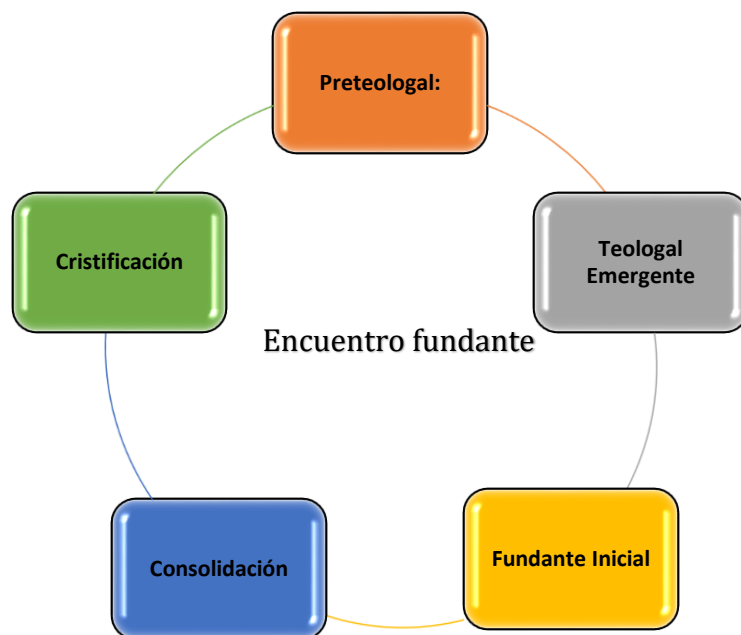
Figura 2. Fases del encuentro fundante.

En la etapa del seguimiento, el encuentro con Jesús decimos que es fundante porque influye directamente en el resto de los encuentros humanos al cambiar nuestra mirada hacia los otros, adquiriendo la persona valor absoluto, constituyéndose el sufrimiento en camino de sabiduría y libertad. Pues el amor se realiza en el realismo de lo humano.