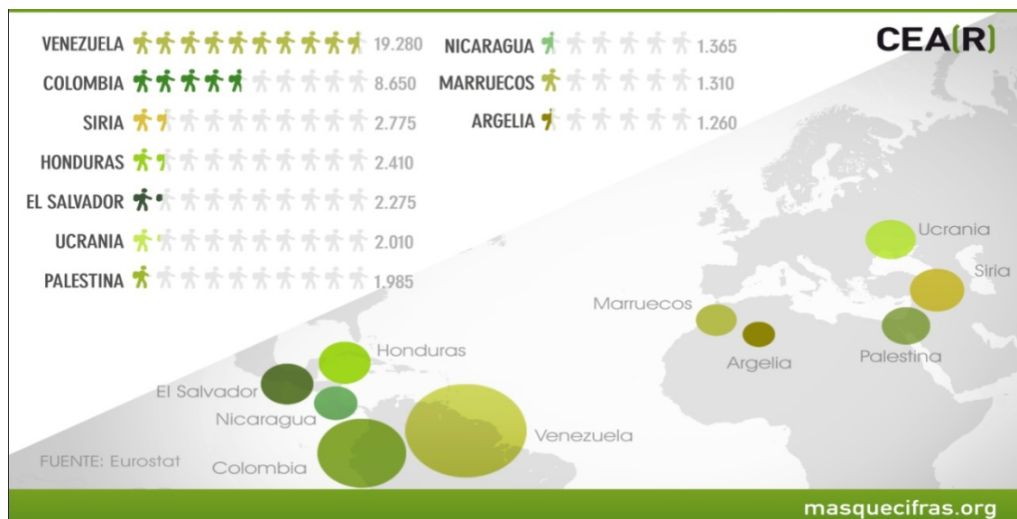
GRÁFICO II. SOLICITANTES DE PROTECCIÓN INTERNACIONAL POR NACIONALIDAD EN ESPAÑA EN EL 2018