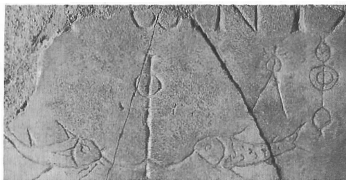
Ilustración 2: peces y ancla de la Salvación

las representaciones de los cristos siriacos en posición de bendición y de predicación. A partir de este punto el arte, ya cristiano bizantino, hará una función de aglutinante en la percepción de la experiencia religiosa que condicionará la herencia posterior. Es imposible hacer un recorrido por la iconografía cristiana sin llenar páginas y páginas de comentarios. No pudiendo realizar este ejercicio por problemas evidentes de espacio, nos queda centrarnos en la intención de vivir nuestra propia fe desde una perspectiva teológica de cara al misterio, experimentándola desde la proximidad de la vida diaria y la belleza contenida en ella.