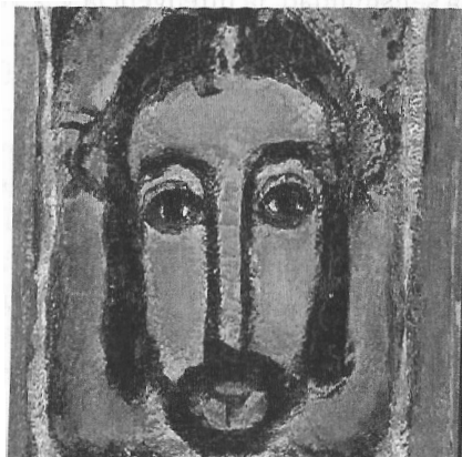
Ilustración 4: Georges H. Rouault: Rostro de Cristo

En occidente nuestra tradición nos habla de una riqueza iconográfica desbordante. Por ejemplo, cuando se estudia teología y arte románico a la vez, no como una simple historia del arte descontextualizada, sino como una teología “visual y real”, nos damos cuenta de la inteligencia de nuestros antecesores cuando diversificaban las visiones de Dios y jugaban con los matices. Los románicos tenían una gran variedad de