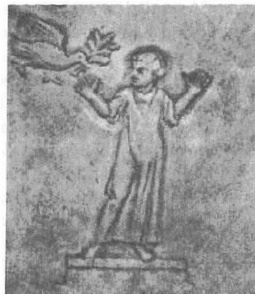
Ilustración 1: orante con alma

El cambio iconográfico de los siglos III y IV acompaña a esta construcción teológica discursiva y se ve afectada en su expresión, como podemos ver en las primeras representaciones de Cristo como principio y fin de la historia. Será el inicio de