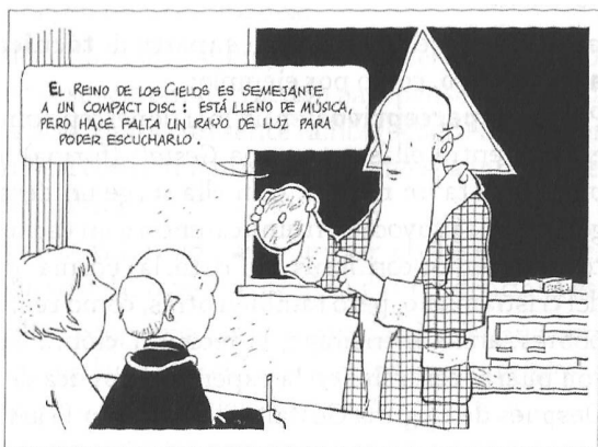
Ilustración 5: José Luis Cortés: El Reino de Dios es como un CD