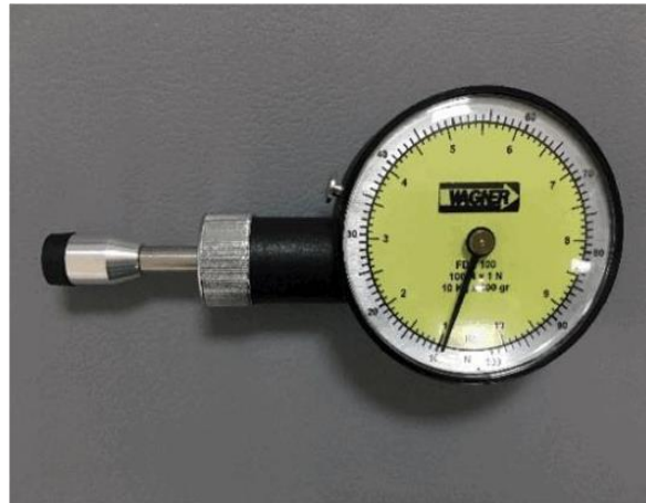
Imagen 1: Algómetro analógico.

El procedimiento se repetirá tres veces sobre el mismo punto y a continuación se calculará la media ponderada de la misma. Entre cada medición se procederá a realizar un descanso de 30 segundos.