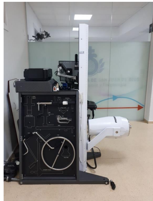
Imagen II: Dinamómetro isocinético. Elaboración propia.