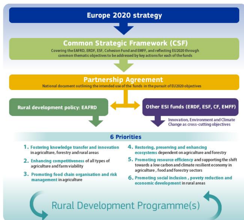
Figura 2: Prioridades de la Política de Desarrollo Rural

Para implementar esta política, se han articulado seis prioridades que se pueden entender claramente con la siguiente infografía de la Red Europea de Desarrollo Rural: