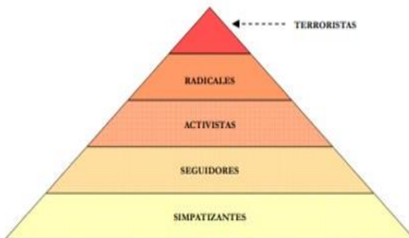
Figura nº 1 – Modelo de pirámide.

Fuente: Factores psicosociales contribuyentes a la radicalización islamista de jóvenes en España. Construcción de un instrumento de evaluación. (Corning y Myers, 2002)