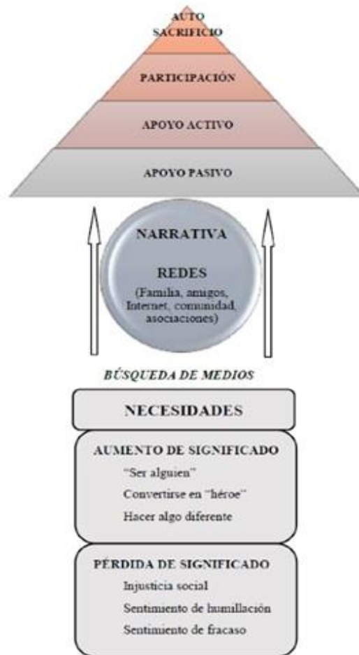
Figura nº2. Modelo 3N en el proceso de radicalización. (Moyano,2019)

En la siguiente figura, esta teoría viene explicada apareciendo los tres factores conectados entre sí: