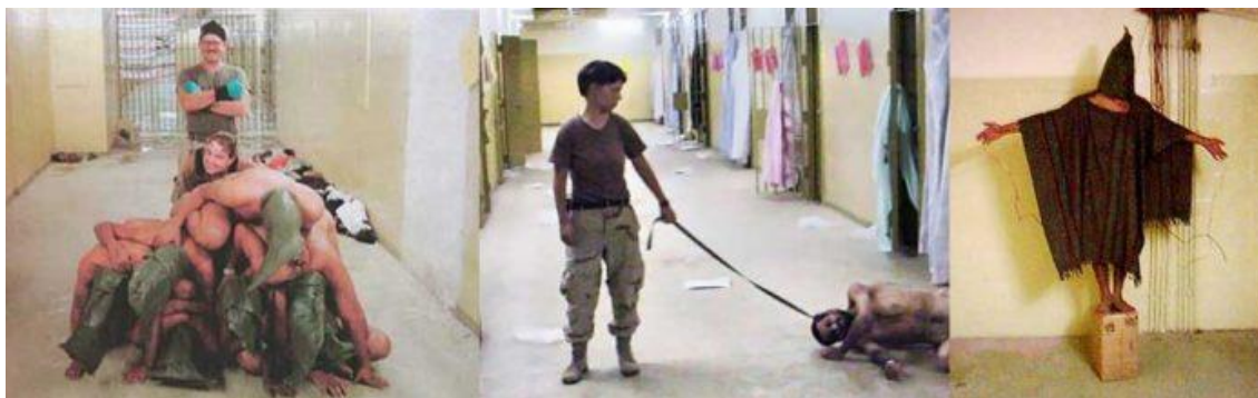
Torture, humiliations... Les photos qui ont révélé l'horreur d'Abou Ghraib (Amandine Schmitt 2016)

El segundo caso es la cárcel de Abu Ghraib, ubicada a 20 kilómetros al oeste de Bagdad, en Irak. El escándalo de Abu Ghraib estalló en abril 2004, después de la publicación de algunas fotos de las condiciones de detención de los prisioneros.