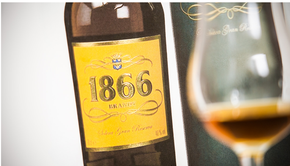
Figura 8: Imagen del Brandy 1866

un gran activo para llevar al mercado americano. El producto utiliza una uva diferente a la de Carlos I, lo cual aporta variedad de sabor a los productos exportados. (Memoria anual de Osborne, 2018) Actualmente, solo cuenta con un único producto y su precio es de 45,50€.