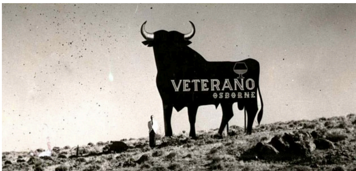
Figura 4: Imagen del primer ‘Toro de Osborne’ en 1956.

debe a la creación, en 1956, del ‘Toro de Osborne’. Inicialmente, el objetivo era la creación de una simple valla publicitaria. Sin embargo, Osborne no era consciente en ese momento de que habían creado un símbolo, no solo de su empresa, sino de todo el país. Habían conseguido que su toro se convertiría en parte del paisaje español, como así reconocería el Tribunal Supremo en 1997. El crecimiento alcanzado en esta exitosa etapa se vería reflejado en las adquisiciones que se sucederían en los años siguientes.