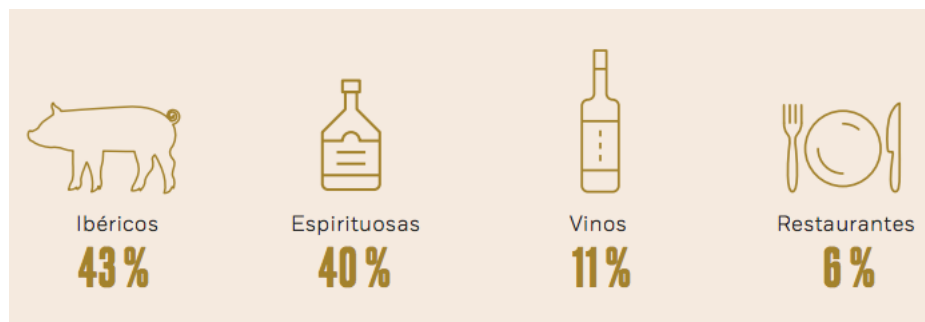
Figura 4: Reparto de negocio de Osborne en 2018

Por último, encontramos los restaurantes, con un 6% de la cuota de negocio y un decrecimiento del 1,4% en 2018. A pesar de esta reducción, la compañía sigue confiando en esta rama, a través de nuevos proyectos como el enoturismo, que permite visitas guiadas u organización de eventos en diferentes bodegas en El Puerto de Santa María, La Rioja o Toledo.