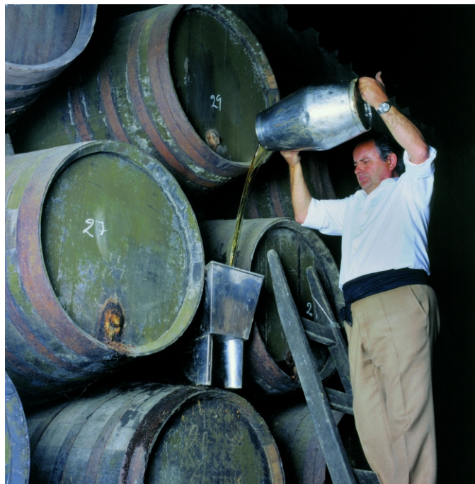
Figura 1: Ejemplo de las sacas y rocíos del sistema de criaderas y solera.

vinicultura jerezana desde el siglo XVIII. “Se trata de un sistema de carácter dinámico, basado en el establecimiento de distintas escalas de envejecimiento (criaderas) por las que han de ir progresivamente pasando los aguardientes hasta alcanzar el nivel deseado de vejez.” (Brandy de Jerez, 2020). Por último, y como es lógico, para ser considerado ‘Brandy de Jerez’, debe haber sido elaborado en la zona de Jerez, la cual comprende los municipios de Jerez de la Frontera, Sanlúcar de Barrameda y El Puerto de Santa María, donde se encuentran las bodegas Osborne.