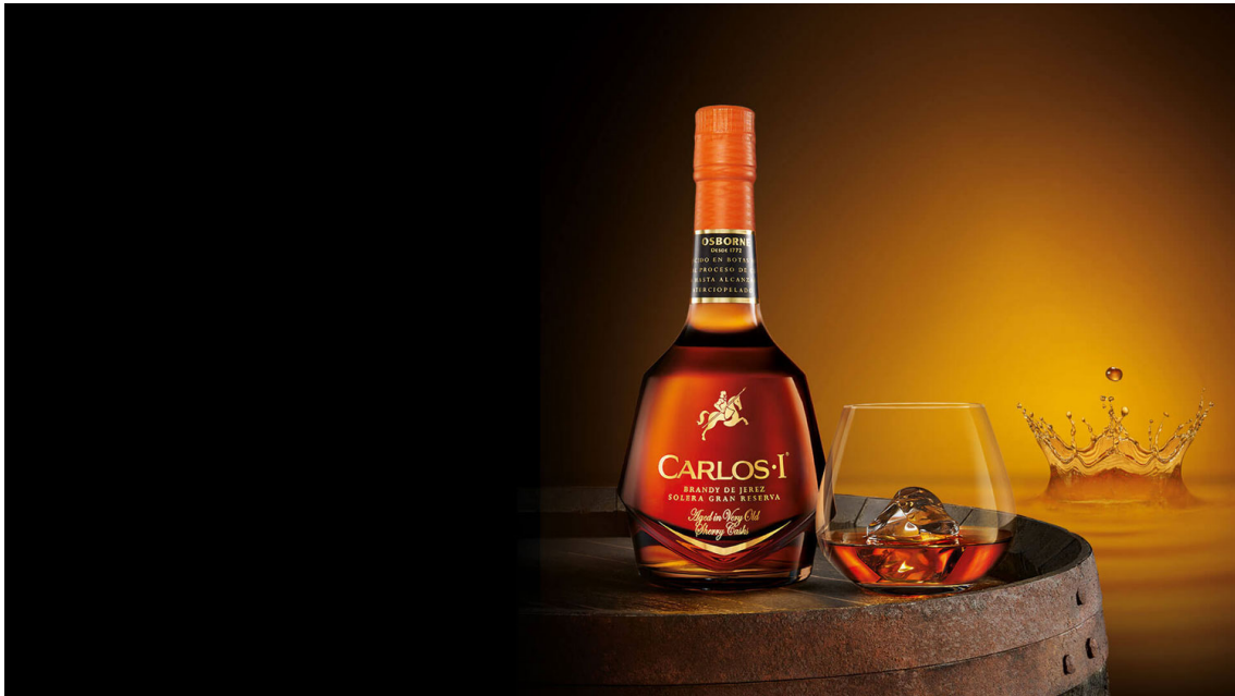
Figura 7: Imagen del Brandy Carlos I

bebidas con nuevos sabores. Un gran ejemplo es el de los ‘flavoured whiskies’, los cuales crecieron un 8% en 2016 (Impact Databank: Shanken’s Impact Newsletter, 2017). Por último, es imprescindible mencionar que el brandy Carlos I 1520 recibió la medalla de oro de los prestigiosos World Spirit Awards en junio de 2019. (Osborne, 2019)