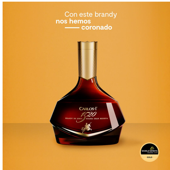
Figura 9: Imagen del Brandy Carlos I 1520 con la medalla de oro de WSA