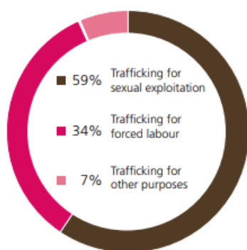
FIG. 19 Share of forms of exploitation among detected trafficking victims*, 2016 (or most recent)