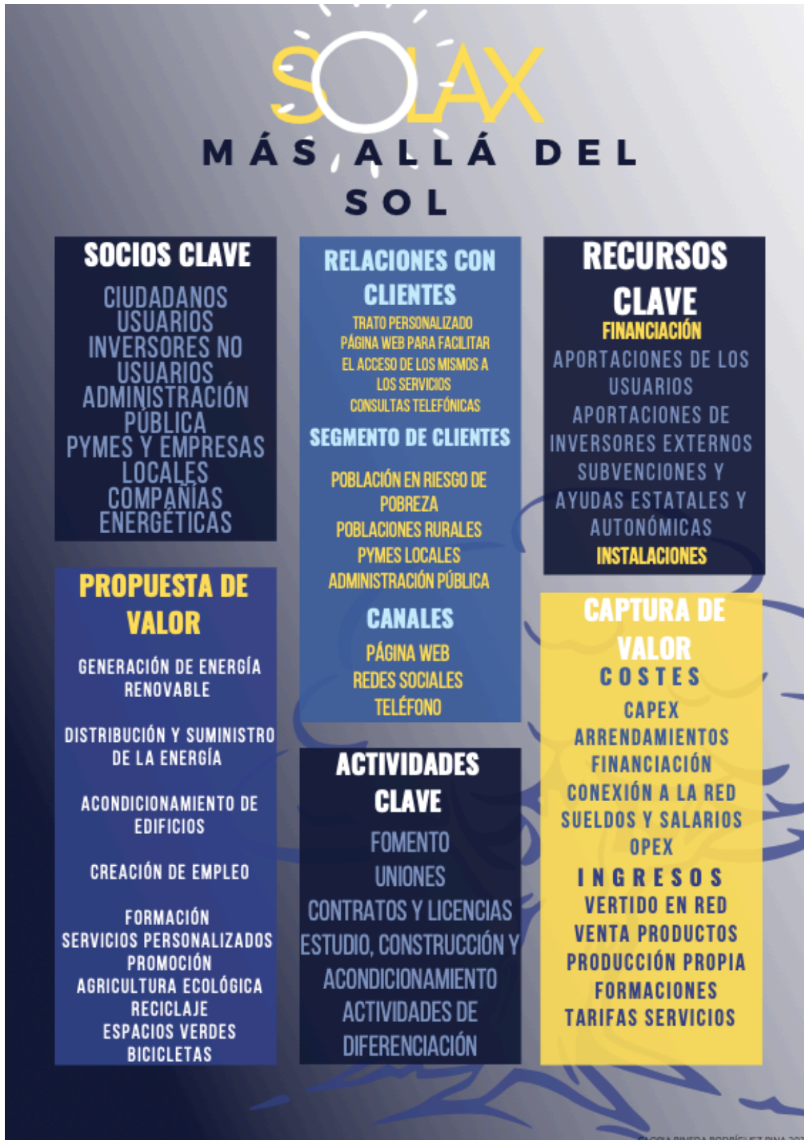
FIGURA 3: Modelo Canvas