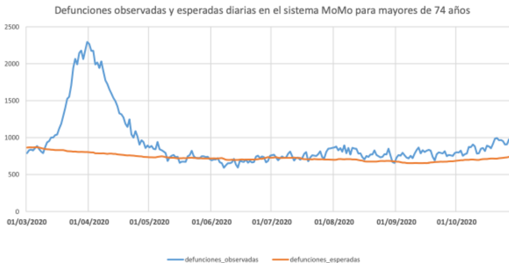
Figura II: Número de defunciones esperadas diariamente para mayores de 74 años vs número de defunciones esperadas

Para evidenciar la mala gestión llevada a cabo en centros de mayores basta con visualizar el siguiente gráfico, que compara defunciones esperadas y observadas de mayores de 74 años a lo largo de la pandemia. Como se puede ver, la situación se normalizó a partir del verano de 2020. Sin embargo, se debe explicar el por qué de la diferencia tan extrema experimentada entre los meses de marzo y abril en residencias de mayores. Necesariamente hubo de ser provocada por una gestión ineficiente de los recursos y de la gestión de la situación para un colectivo tan vulnerable como los mayores de 74 años. El número de defunciones observadas llegó a situarse un 300% por encima de las esperadas.