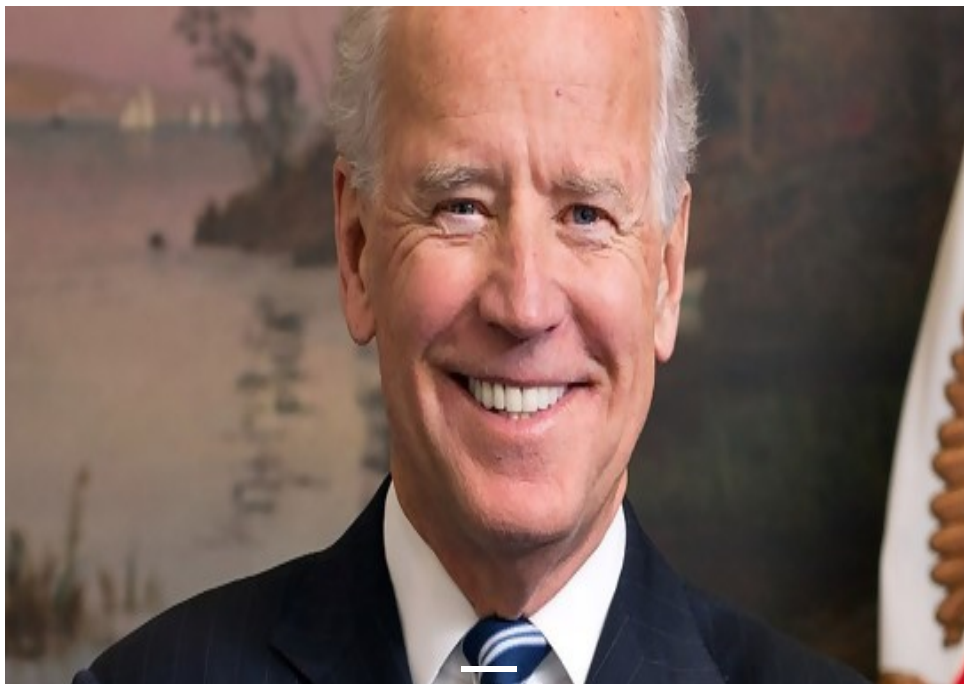
Joseph Biden Jr. un católico y sionista convencido