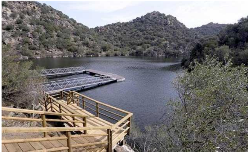
Figura 4. Embarcadero de la Ciudad de vascos .