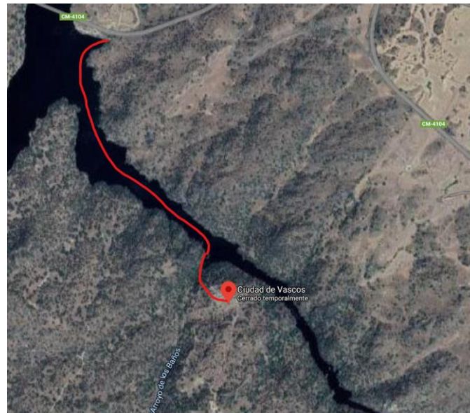
Figura 2. Representa el recorrido de la actividad desde el embarcadero de salida, hasta el embarcadero de llegada.