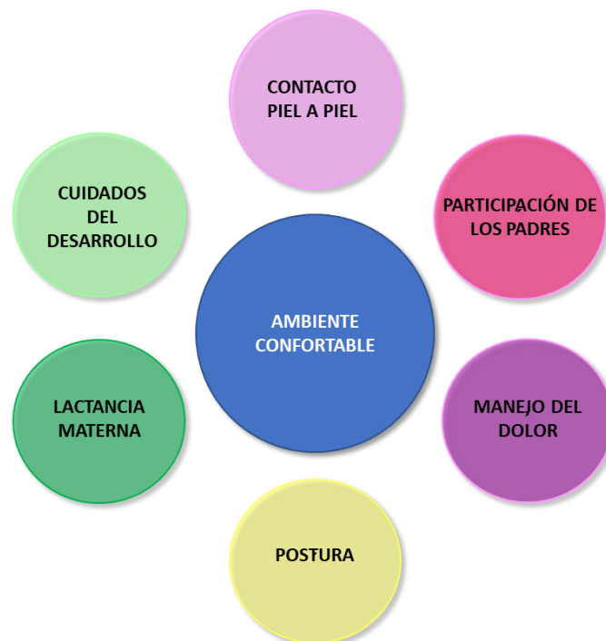
Figura 2. Factores que intervienen en un ambiente confortable. Fuente: Adaptado de Cuidado para el neurodesarrollo. Autor: Egan F. Año: 2016

Por lo consiguiente, los cuidados centrados en el desarrollo van encaminados a la realización de intervenciones dirigidas a optimizar el macroambiente, el cual está constituido por el ruido y la luz y por otro lado, el microambiente, centrado principalmente en la postura corporal, la manipulación y el manejo del dolor (3).