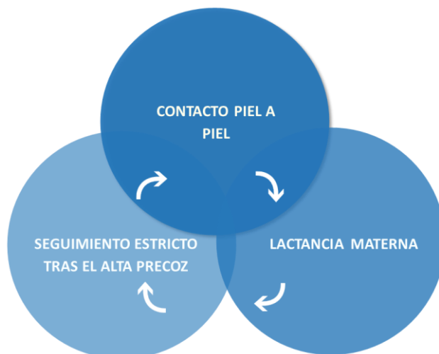
Figura 12. Componentes del método canguro. Fuente: Adaptado de Cuidados neonatales centrados en el desarrollo. Autor: Ruiz A. Año: 2013

Además, existen tres componentes fundamentales en la aplicación del método canguro como son (5):