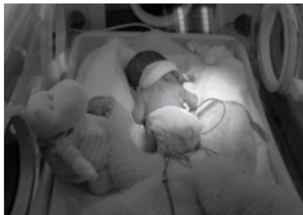
Figura 7. Posición decúbito prono. Fuente: Adaptado de Cuidado para el neurodesarrollo. Autor: Egan F. Año: 2016

Así mismo, aparecen efectos nocivos pero en menor medida como la dificultad para la exploración física y presenta un mayor riesgo de extubación (4).