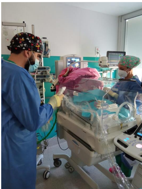
Figura 17. Intervenciones de enfermería. Hospital Universitario 12 de Octubre. Elaboración propia