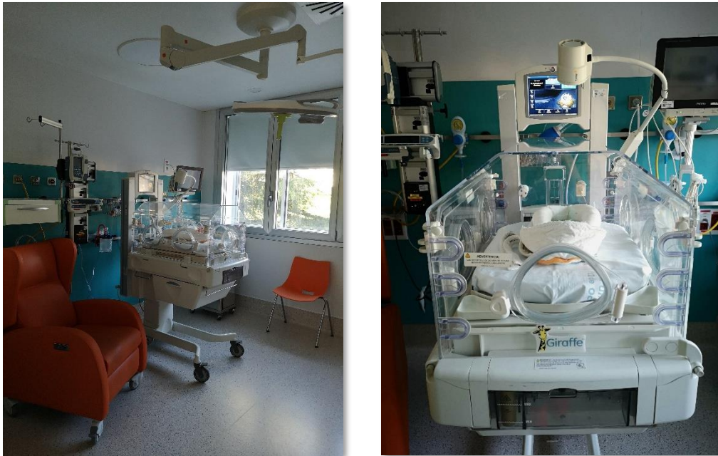
Figura 5. Entorno de la UCIN. Hospital Universitario 12 de Octubre. Elaboración propia.