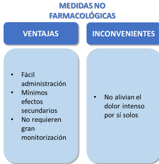
Figura 11. Medidas no farmacológicas. Fuente: Adaptado de Cuidados del neonato prematuro centrados en el desarrollo y la familia. Autor: Sánchez Guisado, MM. Año: 2014