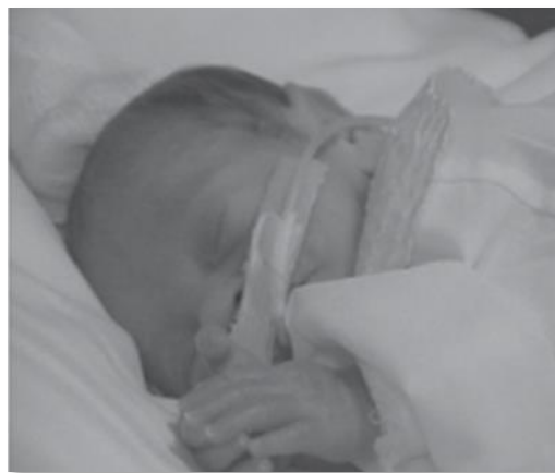
Figura 8. Posición decúbito lateral. Fuente: Adaptado de Cuidado para el neurodesarrollo. Autor: Egan F. Año: 2016

Sin embargo, repercute negativamente en el vaciamiento gástrico cuando se encuentra en el decúbito lateral izquierdo y resulta difícil adaptar al niño cuando presenta una hipertonia en las extremidades (4).