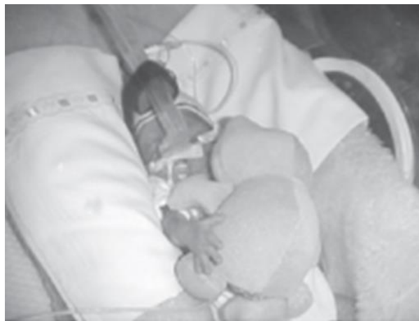
Figura 6. Posición decúbito supino. Fuente: Adaptado de Cuidado para el neurodesarrollo. Autor: Egan F. Año: 2016

Por el contrario, también aparecen efectos perjudiciales como puede ser un mayor esfuerzo respiratorio, aumento el riesgo de aspiración, disminución del ritmo respiratorio en afectaciones como el síndrome de dificultad respiratoria, aumento del gasto de energía, agitación, hiperextensión de cabeza, cuello y hombros y dificulta el acercamiento de las extremidades a la línea media (4).