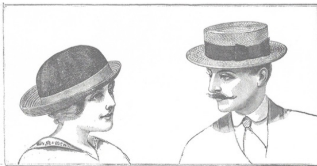
Figura 2: Una señora y un caballero, Max Ernst, 1972 12

Kleist se limita a referir el número de visitantes como notable, pues podían encontrarse en la sala “de la mañana a la noche”. En el texto original de Brentano, esos espectadores 9 que intercambian sus impresiones, carecen de nombre –a excepción de uno de ellos, la señora Kriegsrat–, son denominados genéricamente. Así aparecen: una señora y un caballero, dos jóvenes señoras, dos expertos en arte, una profesora y dos alumnas, una señorita con dos niños rubios y un par de caballeros, una señora y un guía; y, por último, un hombre y el autor del texto 10 . Todos ellos mantienen diálogos diversos sobre la obra de Friedrich, recogiendo en ellos pareceres muy dispares, a favor y en contra, así como en diferentes tonos atendiendo a las condiciones particulares del emisor del discurso en cuestión –niño, hombre o mujer. Así como un caballero define el cuadro como “infinitamente profundo y sublime”, otro afirma que “no sería muy difícil nombrar una docena de cuadros en los que tanto el mar, la costa o el monje han sido mejor pintados” 11 . Se trata pues de una colección de disertaciones que configuran una completa visión de la obra, y una rica descripción de los perfiles asistentes a este tipo de eventos en los albores de las exposiciones públicas; asimismo, supone un testimonio del nacimiento tanto del público del arte, como de la figura del crítico.