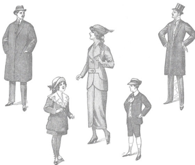
Figura 3: Una señorita con dos niños rubios y un par de caballeros, Max Ernst, 1972

El contraste entre las impresiones recogidas en el texto de Brentano con el testimonio real del artista sobre su obra, nos conduce en primer lugar a comprobar si entre aquellas hay alguna coincidente o aproximada a la intención del pintor. Efectivamente, al menos en uno de los diálogos, mantenido entre dos caballeros y dos niños, los dos hombres hacen con su intervención una notable defensa de la obra de Friedrich, revelando con sus opiniones estar muy cerca de la idea original: