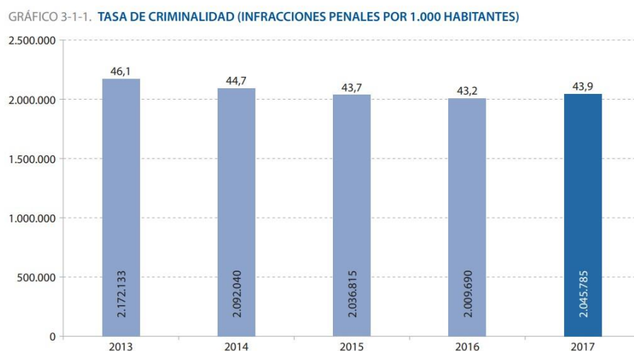
Gráfico 1: tasa de criminalidad española 2013 – 2017

En la gráfica que se encuentra a continuación se comprueba que la tasa de criminalidad no ha disminuido, aún con la incorporación de la pena al ordenamiento jurídico español.