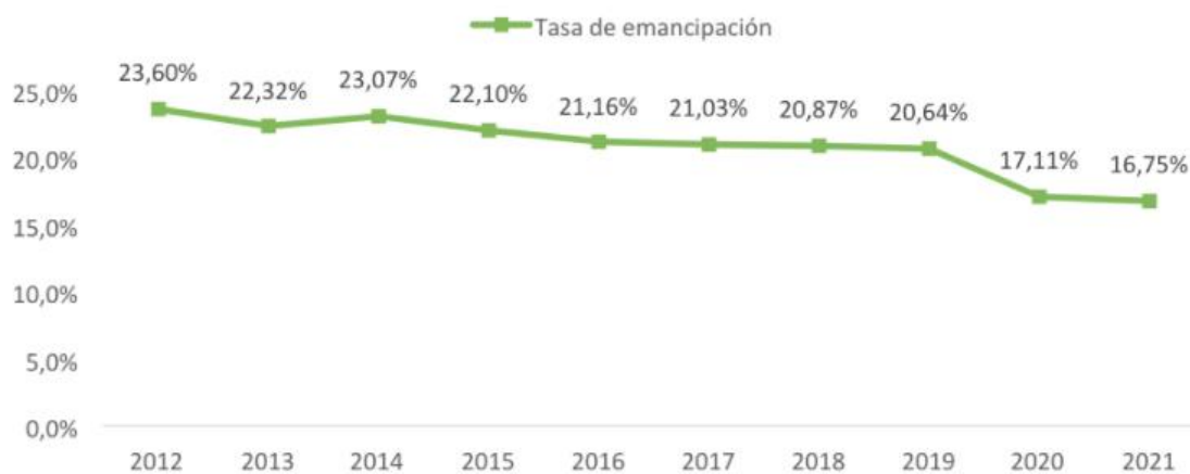
Figura 2: Evolución de la tasa de emancipación