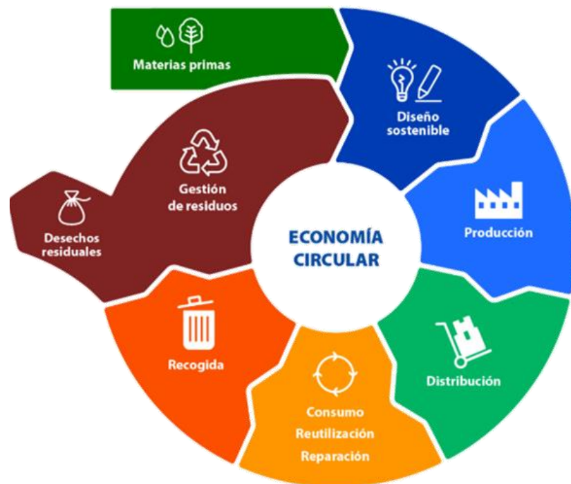
Ilustración 2: Modelo de economía circular

residuos y la contaminación, mantener los productos y materiales en uso a su máximo valor y regenerar los sistemas naturales. Además, este enfoque se basa en una transición hacia fuentes de energía renovables y materiales sostenibles, desvinculando la actividad económica del uso de recursos finitos. La Fundación Ellen MacArthur subraya que la economía circular es un marco de soluciones sistémicas que aborda desafíos globales como el cambio climático, la pérdida de biodiversidad, la contaminación y la generación de residuos.