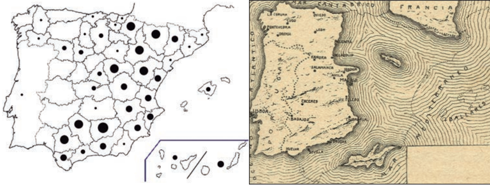
Figura 1a y 1b: Ubicación actual de las salinas en España (izda.) y representación del Mar de Thetys que cubriría la península ibérica hace 200 millones de años (izda.: Carrasco & Hueso 2008; dcha.: Fábrega 1928).

reciente, el Mioceno, de entre 5 y 23 millones de años de antigüedad. En ambos casos se produjeron fenómenos de inundación y evaporación sucesivos que resultaron en la formación de depósitos subterráneos de evaporitas. Cuando estos depósitos quedan accesibles en forma de manantiales que afloran a la (sub-)superficie, es factible su explotación como salina.