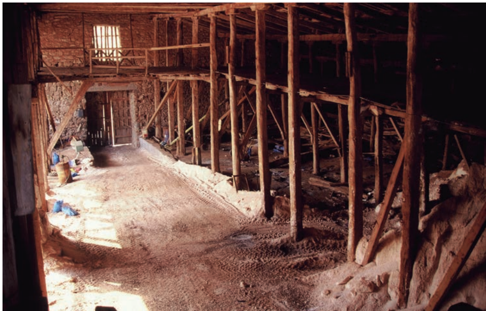
Interior del alfolí de San José en Imón donde se aprecia la pasarela por la que se introducía la sal desde la zona de producción y el fondo diáfano donde ésta caía y se ensacaba, para ser sacada por la parte frontal, al fondo de la imagen. La fotografía fue tomada en 1996; hoy en día la cubierta ya no existe (Salinas de Imón, Guadalajara).

fuerzos de racionalización de la industria salinera que promovió el rey Carlos III en el siglo XVIII y que aún se ven en pie en muchas salinas, como es el caso de Poza de la Sal, Imón o la de San Juan en Saellices de la Sal (Guadalajara). Cabe destacar en este tipo de edificios el Real Alfolí en Gerri de la Sal, que por la ubicación de las salinas en la orilla del río Noguera Pallaresa, hubo que construirse en pleno caso urbano. Se trata de un edificio con una apariencia más urbana que industrial, pero con una sólida construcción de imponentes muros interiores, para sostener