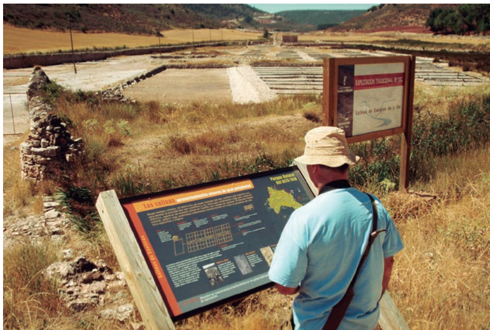
Visitante leyendo un panel interpretativo que explica el funcionamiento de una salina, con la propia salina al fondo. Este tipo de paneles son una opción útil y relativamente barata para dar a conocer el patrimonio de un lugar (Salinas de San Juan, Saelices de la Sal, Guadalajara, antes de su restauración).

son menos habituales. Aquellas salinas que tienen algún plan de uso público, sea éste formal o informal, como son Salinas de Añana, Rambla Salada o Poza de la Sal, ofrecen visitas guiadas, visitas temáticas o eventos en sus salinas. Cuando no parte de los mismos propietarios, suelen hacerse visitas más ocasionales de la mano de asociaciones culturales o de grupos con un interés específico. Tal es el caso de Salinas Espartinas, en Madrid, que solían enseñarse en colaboración con el Ayuntamiento de Ciempozuelos. Las salinas más emblemáticas suelen en-