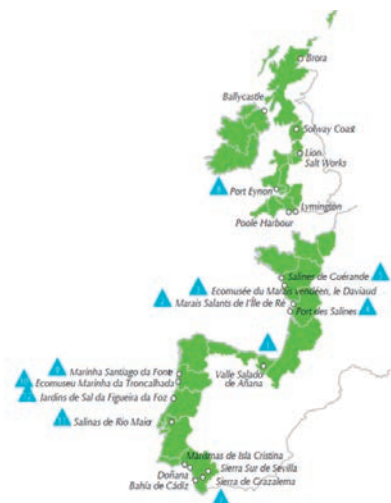
Figura 6: Mapa de los miembros fundadores de la Sal Tradicional – Ruta del Atlántico durante el proyecto ECOSAL Atlantis

la posibilidad de hacerse socio a título particular, como persona interesada en el tema. Esta ruta está en este momento abierta a nuevas incorporaciones.