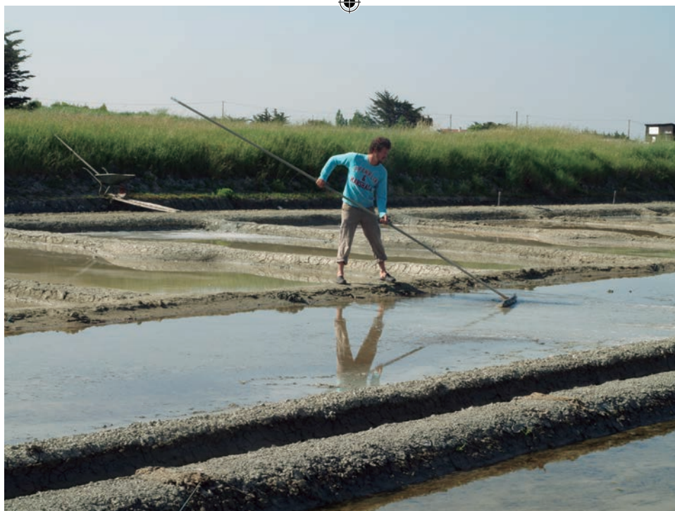
Salinero de la península de Guérande demostrando el uso de la herramienta típica para recoger la sal, aunque ésta no se ve por ser fuera de temporada. Obsérvese la longitud del mango, que sirve para alcanzar cualquier punto de la superficie de la balsa sin necesidad de pisarla.

acaba en una tabla de madera que actúa de paleta. Con esta herramienta se puede remover la salmuera y permitir el desplazamiento de los cristales posados en el fondo de los cristalizadores sin arrastrar partículas de arcilla. A pesar de ello, esta sal adquiere un tono grisáceo tan característico (Buron 1999, Thomson 1999, Delbos 2007).