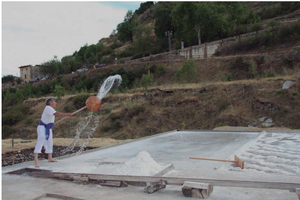
Salinero pozano demostrando cómo se reparte la salmuera con una herramienta denominada cuchara o botadera . Este sistema permite crear una capa muy fina de salmuera que se evapora con relativa rapidez y obtener así una cosecha continua de sal (Salinas de Poza de la Sal, Burgos).

En el interior, las salinas del norte como Añana, Gerri de la Sal o Poza de la Sal emplean en la actualidad la siembra a voleo. También en ellas se construyeron esos almacenes temporales, ubicados en ocasiones debajo de las propias eras de