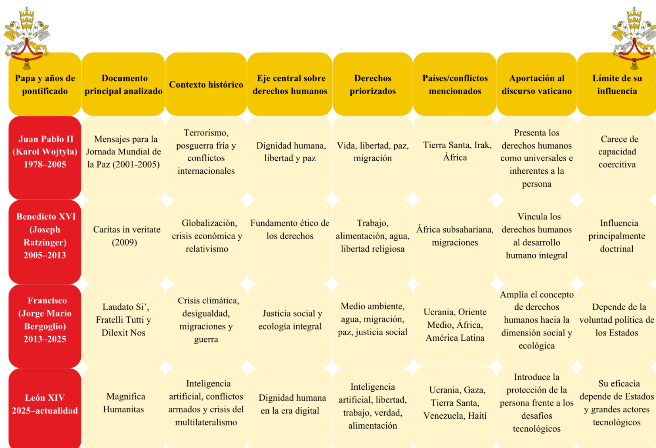
Tabla II. Evolución del pensamiento pontificio sobre derechos humanos en el siglo XXI.

Nota. Elaboración propia a partir de Juan Pablo II (2001, 2002, 2003, 2005), Benedicto XVI (2008, 2009), Francisco (2015, 2020, 2024), León XIV (2026) y Noticias ONU (2025).