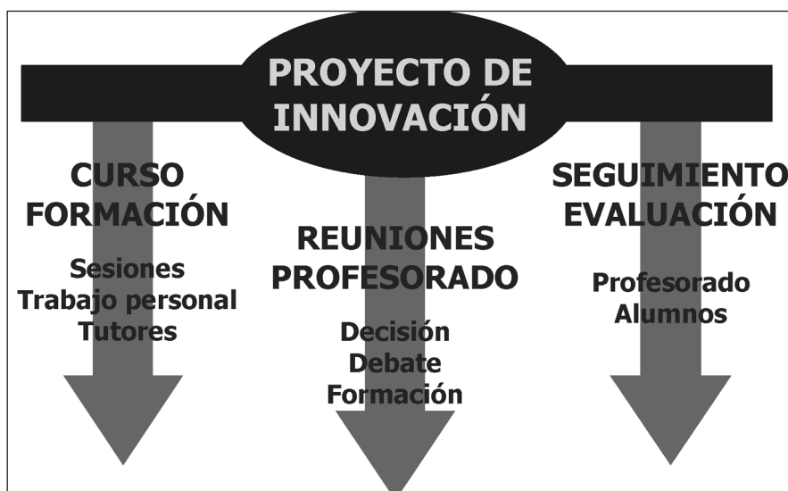
GRÁFICO 2.— Respuestas a las necesidades técnicas y didácticas

Los elementos técnicos y didácticos de este proyecto de innovación estaban muy imbricados. Esto nos llevó a darles respuesta a través de una red globalizada de actuaciones que podemos resumir en tres ejes fundamentales y relacionados entre sí.