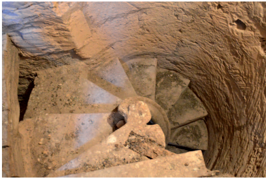
Fig. 1. Escala del campanar, 1566.

Baltasar de Borja ordenà iniciar les obres, que no es dugueren a terme fins a 1638 i 1639, quan amb la decoració de les claus de la nau es donaren per acabades. 19 Just després, la visita pastoral del bisbe fra Joan de Santander el 1641 reflecteix com el temple seguia comptant amb sis capelles, un cor i una sagristia que es renovaria anys després, el 1669. 20