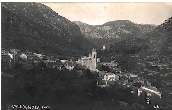
Fig. 3. Valldemossa Mallorca. Tarjeta postal Truyol, Palma, c. 1920.

de l'església de Sant Joan Baptista de Muro, que l'arquitecte projectà el 1862. 35