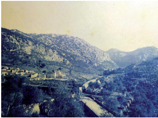
Fig. 2. Valldemossa. Fons fotogràfic de la Biblioteca Lluís Alemany, Palma, Inici segle XX.

rístics de l'arquitecte com la sobrietat, la geometria o els frontons triangulars, que llavors utilitzaria a Valldemossa.