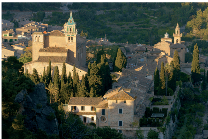
Fig. 6. Cartoixa i església parroquial.

ma definitiva per anar a desembocar en l'obra, feixuga però mestrívola del campanar de la parròquia de Santa Maria del Camí. 48