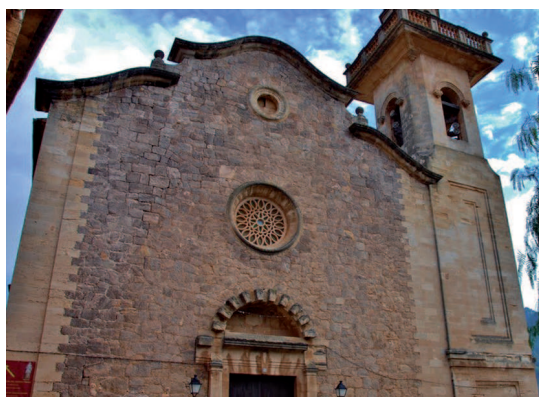
Fig. 4. Esglésies parroquials El Terreno i Valldemossa, projectes de 1924.

El projecte de l'arquitecte Forteza estava inspirat en el campanar de Cartoixa. El rector de la parròquia va agafar un mestre que vivia a Palma. Vaig fer un dibuix tamany natural del contorn del coronament i el mestre va fer un motlle. D'una sola cara, i aquest coronament està fus, de ciment, no picat, com la part de baix, que és d'obra. 40