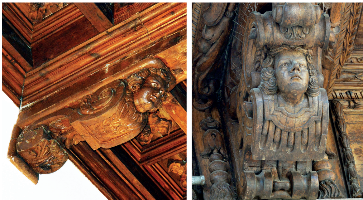
Figura 5. Mènula del convent de Sant Francesc; mènula de Cort.

dispensable importar la fusta. Respecte a aquesta qüestió, s'ha pogut documentar que, mentre s'emprava allà, el llenyam era adquirit també per servir en altres construccions de la fortificació 45 . Tradicionalment s'han establert distintes hipòtesis sobre la seva procedència, des del «llenyam vermell tortosí» que Marià Carbonell documentà en relació amb la fabricació d'enteixinats o caixes d'orgue, fins a la identificació de Miquel Ballester referint-se a un tipus de pi importat de València 46 .