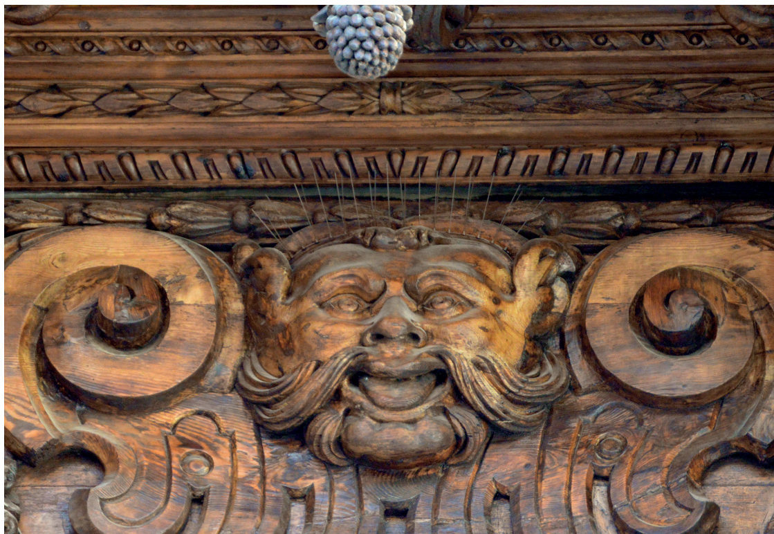
Figura 8. Detall de màscara.

rem en les reivindicacions que s'alçaren a favor de conservar les distintes obres de fusteria de Cort.