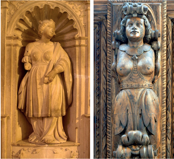
Figura 3. Trona de Joan de Salas, catedral de Palma; cariàtide de Cort.

El programa iconogràfic concret que desenvolupen les figures de Cort no està del tot clar. Els atlants es complementen amb cariàtides amb tors humà i la part inferior foliàcia, que s'han comparat amb sirenes o amb mascarons de proa de vaixell. Però la falta de documentació no permet concretar-ne un significat més precís, més enllà de la seva utilització dins el llenguatge classicista i la seva funció com a elements de suport.