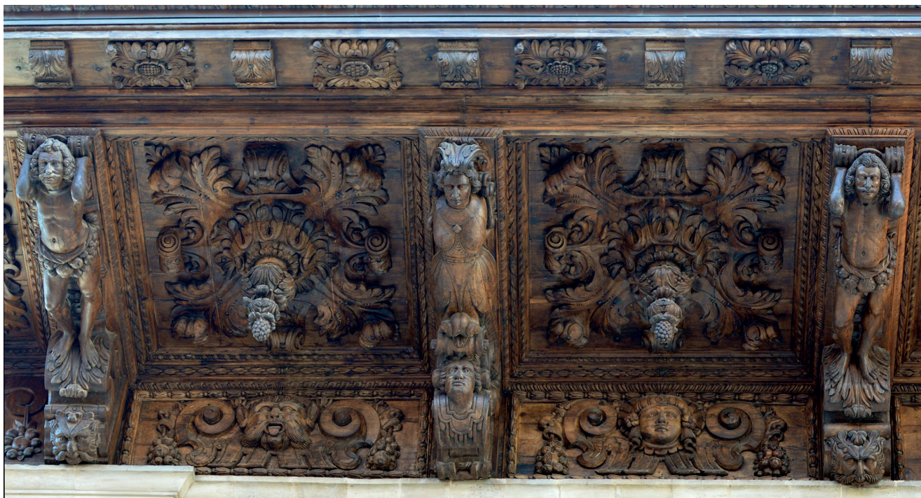
Figura 6. Vista parcial del voladís de Cort.

Així com es preveia fabricar el sostre interior en sis mesos, la volada resultava molt més complexa. No se'n sap la data exacta d'inici, però se situa entorn de 1667, quan s'acabà l'obra de pedra. Alguns autors han plantejat possibles cronologies que, tanmateix, mai s'han pogut concretar 58 . Gràcies a Elvira González, avui sabem que el 1673 els treballs es trobaven ja avançats, perquè fou quan s'instal·laren els plafons del fris, segons una inscripció descoberta a llapis en un d'ells 59 . Però no hi ha cap testimoni més que expliqui de quina forma es desenvolupà l'execució fins a 1680, quan, amb la visura citada, l'obra es donà per conclusa. El cert és que es tracta d'un interval temporal molt llarg, malgrat la complexitat d'una peça que, sens dubte, revela la personalitat particular del seu artífex (figura 6).