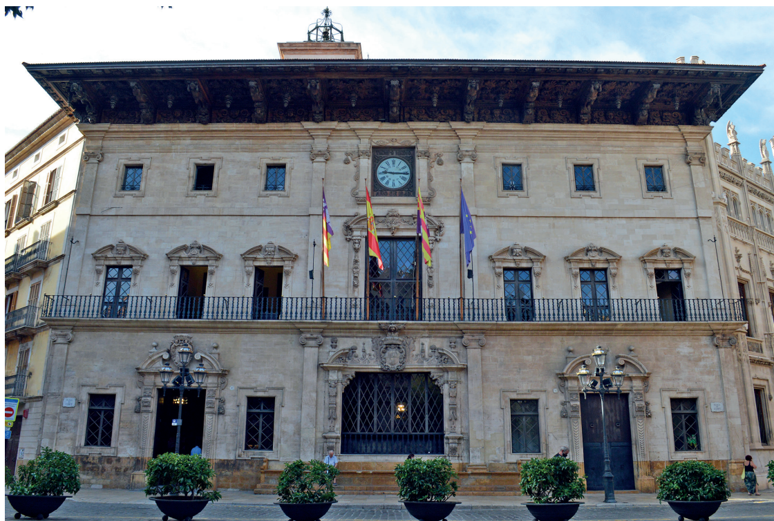
Figura 9. Façana de Cort.

lupament constitueix encara la coberta dels actes públics que es realitzen a Cort (figura 9).