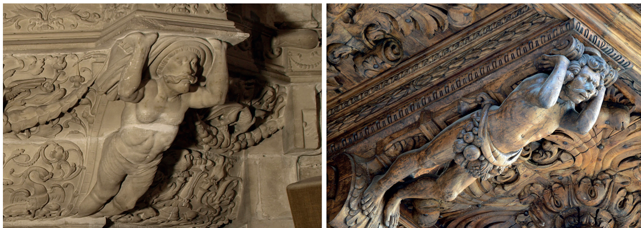
Figura 2. Trona de Joan de Salas, catedral de Palma; atlant de Cort.

java així treballs modulars amb altres dominats per la talla fina 15 .