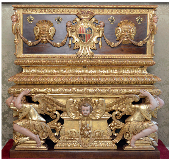
Figura 4. Arca de les insaculacions, Joan Oms.