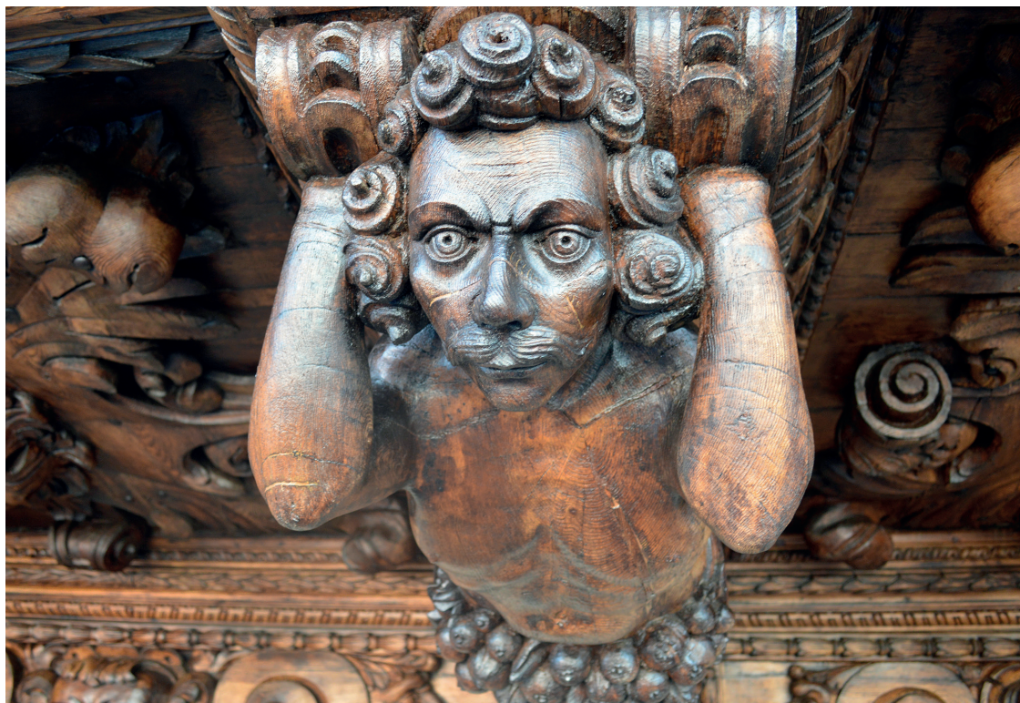
Figura 7. Detall d'atlant.

tor prengué del frontis, de la tradició familiar o d'altres edificis ciutadans es modificà en passar pel filtre del seu treball particular.