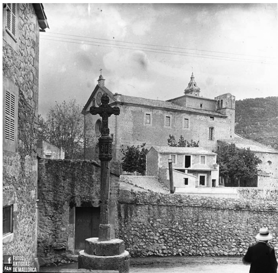
Fig. 6. Creu de la Vila de Dalt cap a 1915.