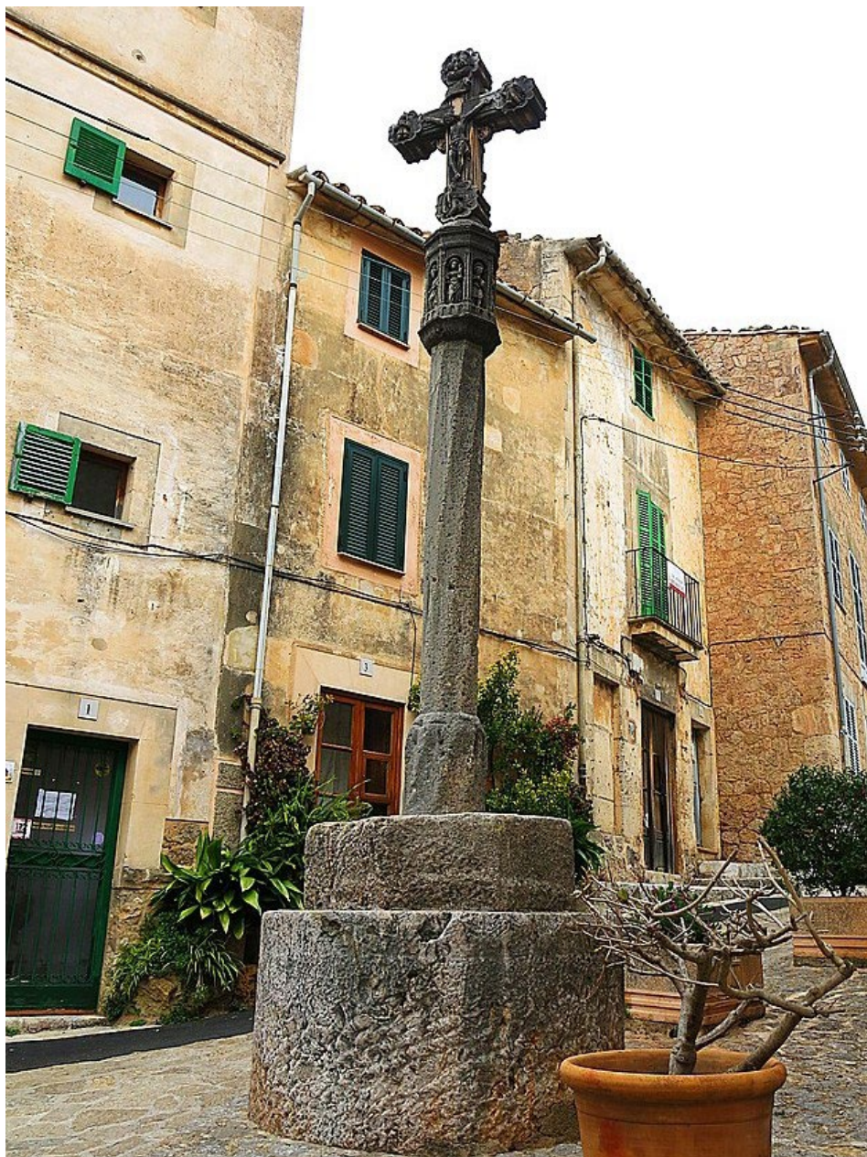
Fig. 1. Creu de la Vila de Dalt o de l'Abeyador.