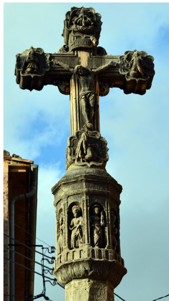
Fig. 2. Anvers de la creu.