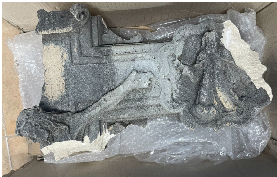
Fig. 8. Fragment de la creu rompuda (2023).