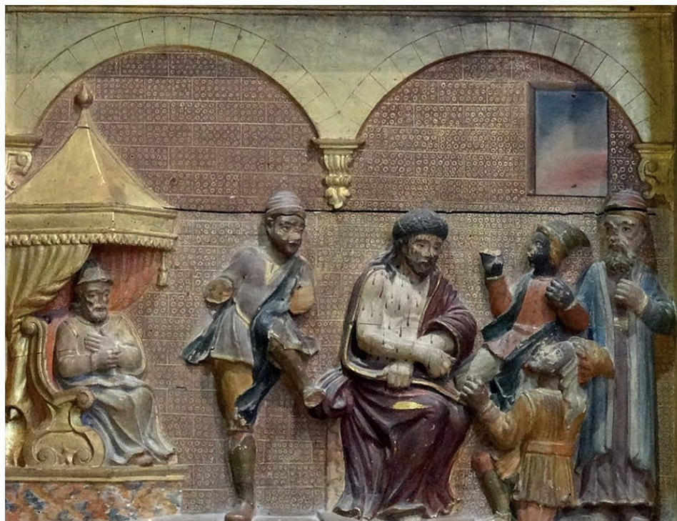
Fig. 10. Relleu de la coronació d'espines del retaule del Roser de Pollença, obra de Rafel Torres Palerm (1727).