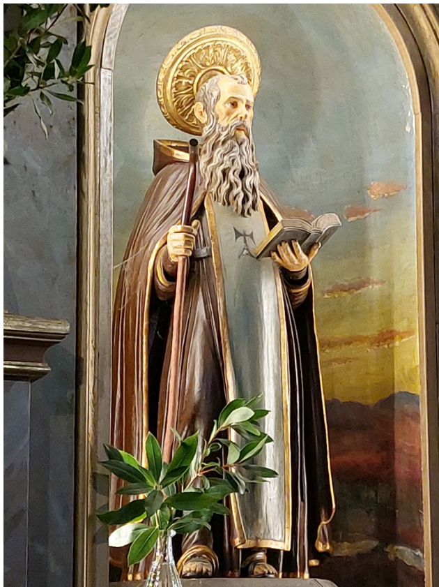
Fig. 9. Sant Antoni de Viana, obra de Rafel Torres Palerm (1709). Ermita de la Santíssima Trinitat, Valldemossa.