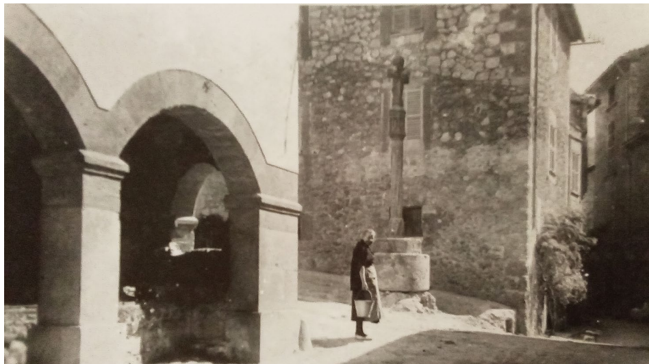
Fig. 7. Creu de la Vila de Dalt cap als anys trenta. Arxiu Andreu Muntaner i Darder. Fotografia d'AMENGUAL GOMILA, B.; FIOL TOMÀS, G.: Valldeossa imatges d'ahir... , p. 36.