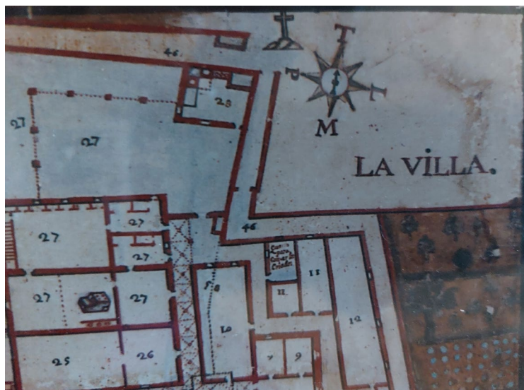
Fig. 4. Fragment de la Planta de la Cartuxa de Jesús Nazareno de Mallorca en Vall de Mussa . Any 1737, de Lorenzo Solís. Cel·la de la Cartoixa de Valldemossa.