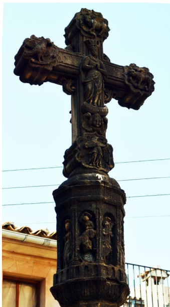
Fig. 3. Revers de la creu.