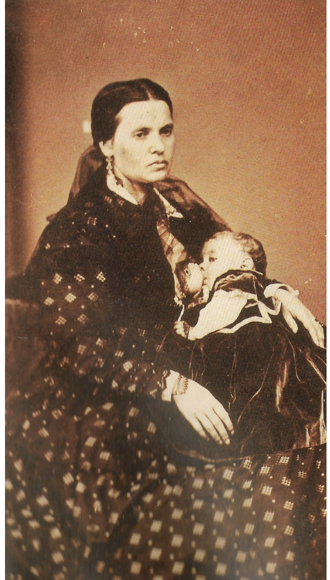
Figura 3. Mujer amamantando a bebé.