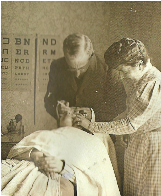
Figura 1. Examen físico a mujer realizado por un médico.