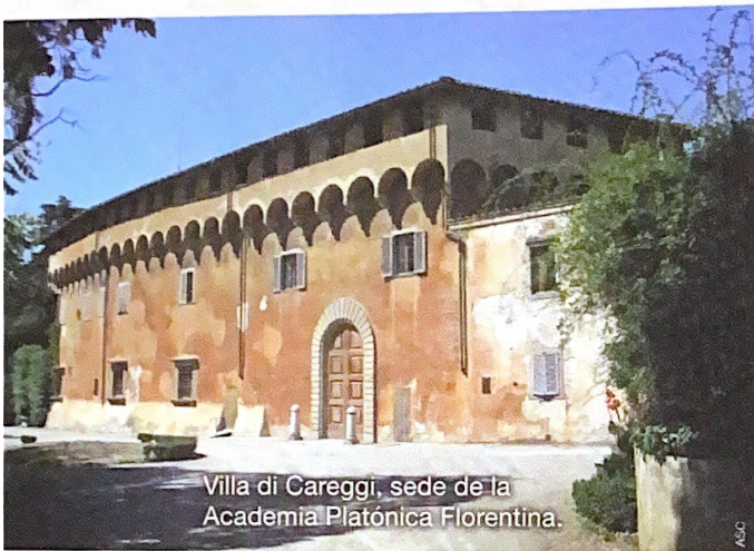
Villa di Careggi, sede de la Academia Platónica Florentina.

vió en Rávena... Y, casualidades del destino, un siglo después, en Florencia, nacería el uno de marzo de 1445 en un barrio de trabajadores del arrabal de Solferino, Alessandro di Mariano di Vanni Filipepi, apodado Sandro Botticelli. Pintor del quattrocento italiano, considerada «edad de oro» por el esplendor artístico que la ciudad alcanzó gracias al mecenazgo de los Médici. La «edad y el tiempo» los une en un ejercicio histórico y sincrético. Ambos logran la proximidad y la conexión de quien se acerca a las páginas y a la pintura con el paso de los años.