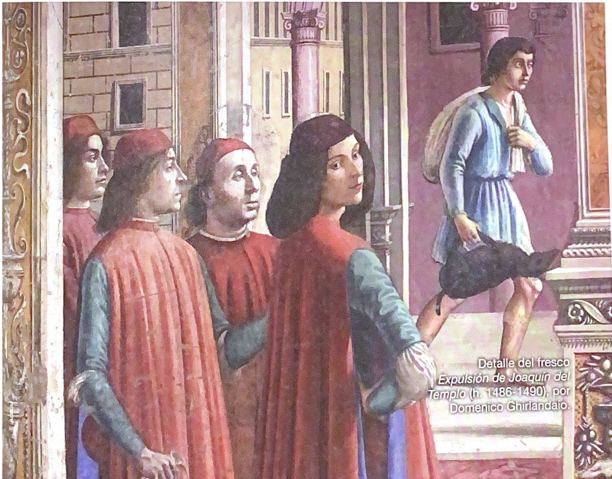
Detalle del fresco Expulsión de Joaquín del Templo (h. 1486-1490), por Domenico Ghirlandaio.

Filóloga (Universidad Pontificia de Comillas)