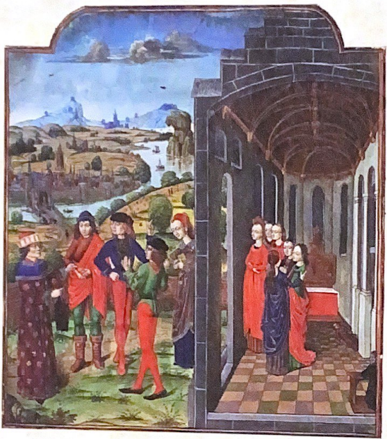
Giovanni Boccaccio y florentinos que han huido de la plaga, en manuscrito iluminado del s. xv.

bre los mortales por la justa ira de Dios para nuestra corrección que había comenzado algunos años antes en las partes orientales privándolas de gran cantidad de vivientes, y continuándose sin descanso de un lugar en otro, se había extendido miserablemente a Occidente» ( Decamerón, Primera Jornada ). Un ejemplo de lo mejor de la literatura de la Europa del siglo xx, la que enfrenta al hombre contra su destino y analiza el sentido de la vida desde un punto de vista innovador y existencialista es La peste de Albert Camus (1913-1960), publicada en 1947. Se trata de una novela esencial, de pura enjundia humanista. Fabular resulta muy tentador si se hace desde el subjetivismo como el Decamerón de Boccaccio, a quien la peste que asoló Florencia en 1348 le inspiró la colección de sus relatos, alguno de ellos base para ciertas tablas de Botticelli, inclinado por un estilo basado en la delicadeza, la gracia y un cierto sentimentalismo. Los tres «artistas» con sus obras desafían al lector y al espectador, porque se presupone que algo conoce del tema tratado y parece que se le exige una implicación. Para algunos expertos en arte, Botticelli «sobrepasó los límites de su generación al pintar como un visionario» en cuyas obras se adivinaba la impronta del realismo gótico matizada por su admiración y el profundo estudio que el artista dedica a la Antigüedad. A través de un viaje histórico, encontramos similares inquietudes,