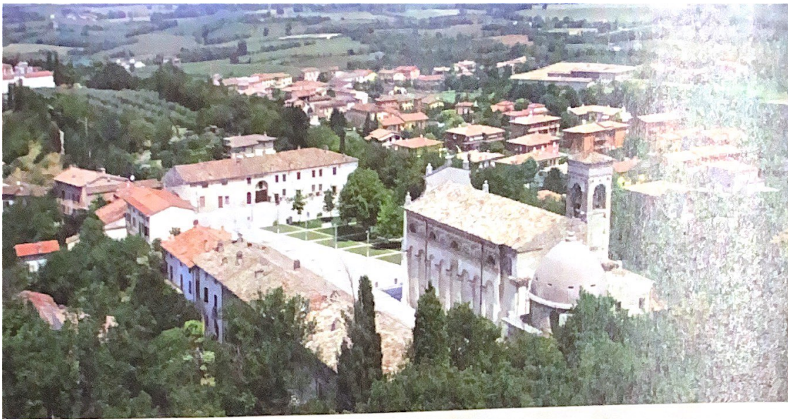
Iglesia de San Pietro in Vincoli, en Solferino, lugar de nacimiento de Sandro Botticelli.