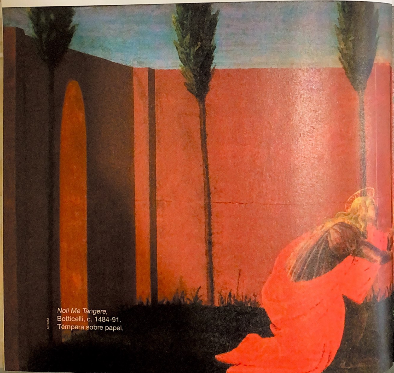
Noli Me Tangere, Botticelli, c. 1484-91. Témpera sobre papel.