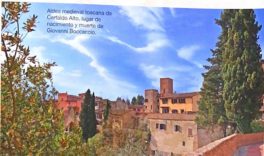
Aldea medieval toscana de Certaldo Alto, lugar de nacimiento y muerte de Giovanni Boccaccio.