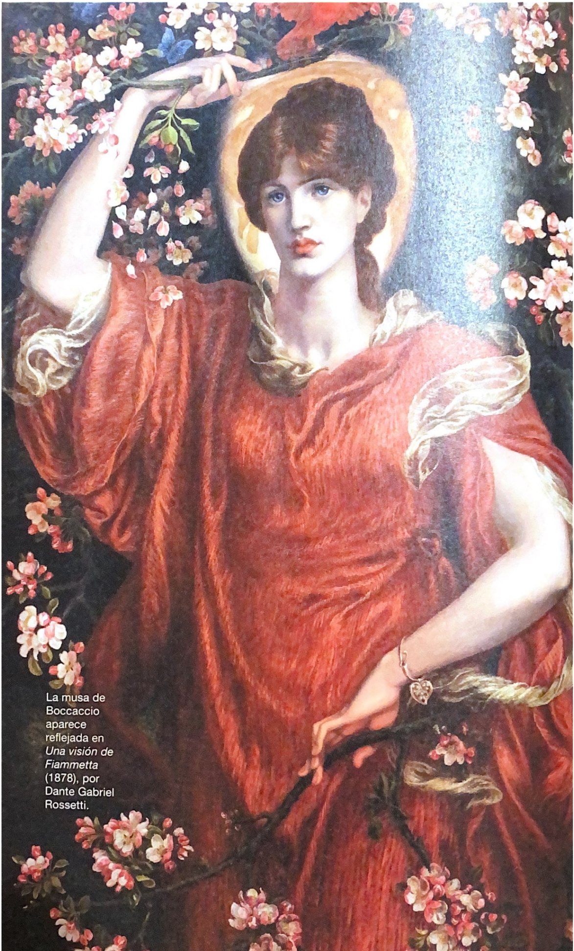
La musa de Boccaccio aparece reflejada en Una visión de Fiammetta (1878), por Dante Gabriel Rossetti.