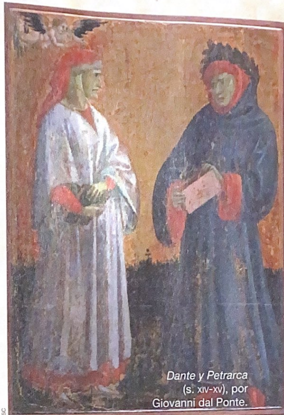
Dante y Petrarca (s. XIV-XV), por Giovanni dal Ponte.

Cada uno de ellos en su época y con el género artístico que mejor los define, son muy valo-