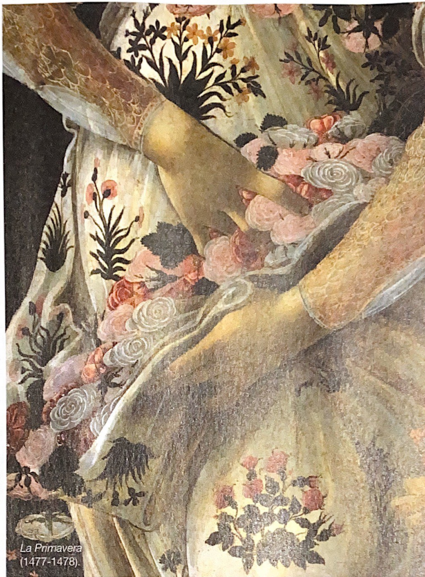
La Primavera (1477-1478).