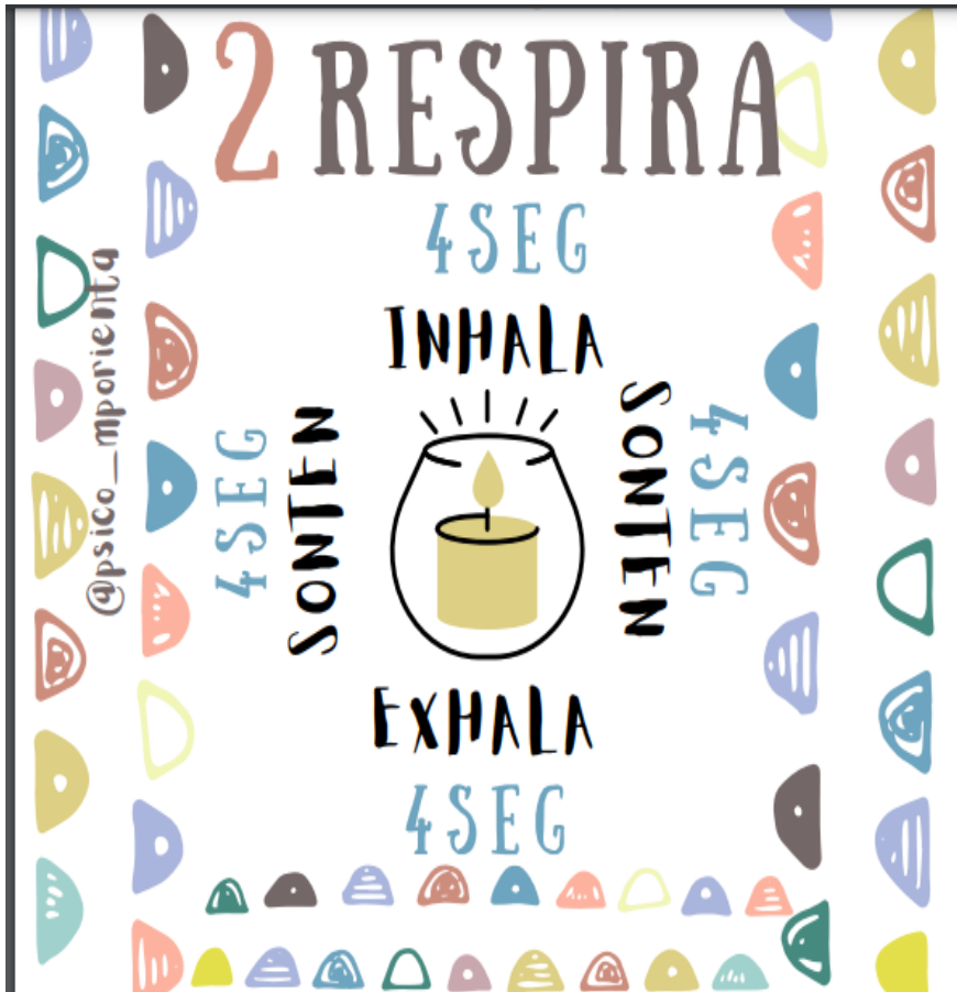
Anexo 1 y 2