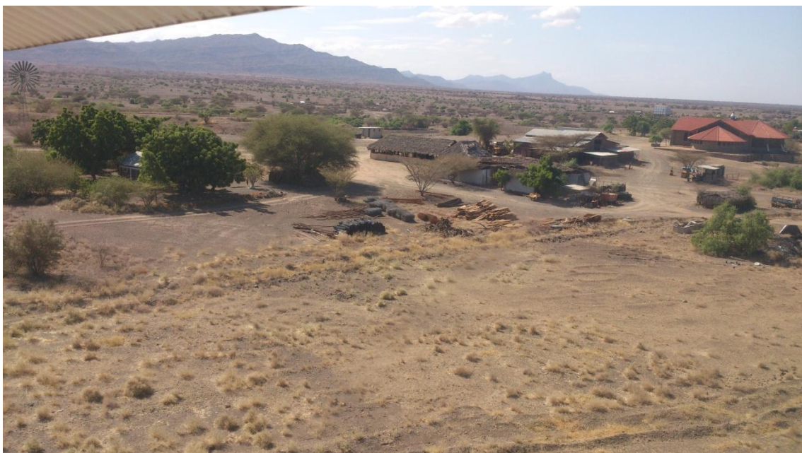
Imagen 2: Misión Central en Nariokotome

La Misión de Nariokotome, cuya construcción comenzó en el año 1993, es la sede principal de la Comunidad. Esta misión es esencial como centro desde el que se planifican y ejecutan numerosas actividades de desarrollo para la zona de Turkana, entre las que cabe destacar el abastecimientos a centros de rehabilitación nutricional donde se alimenta diariamente a mas de 3.250 niños, un vivero de árboles y semillas para su distribución en los alejados centros de población, formación de agricultores, distribución de comida por trabajo, almacenamiento y distribución de los materiales de construcción para presas, pozos y centros nutricionales y talleres de reparación de maquinaria entre otros.