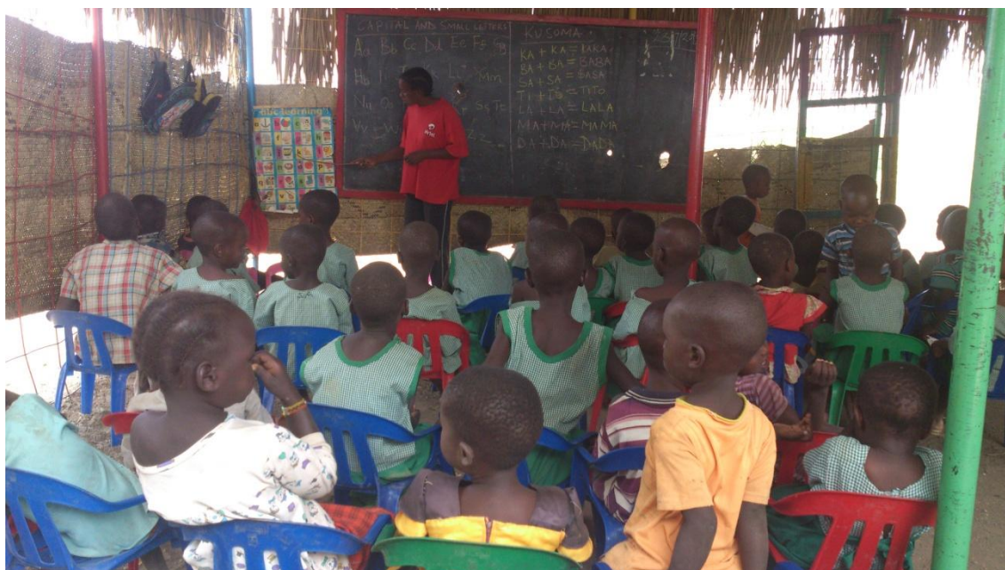
Imagen 6: Unidad Nutricional donde los niños aprenden a leer y escribir

Las labores que se realizan en estos centros nutricionales son fundamentales por dos razones. En primer lugar, porque educan en valores a los niños desde su más temprana edad y les inculcan prácticas saludables tan básicas como la higiene o la prevención de enfermedades. Y, en segundo lugar, porque los niños aprenden el verdadero significado de la educación y la importancia de esta para sus futuros y los de sus familias (nota del autor).