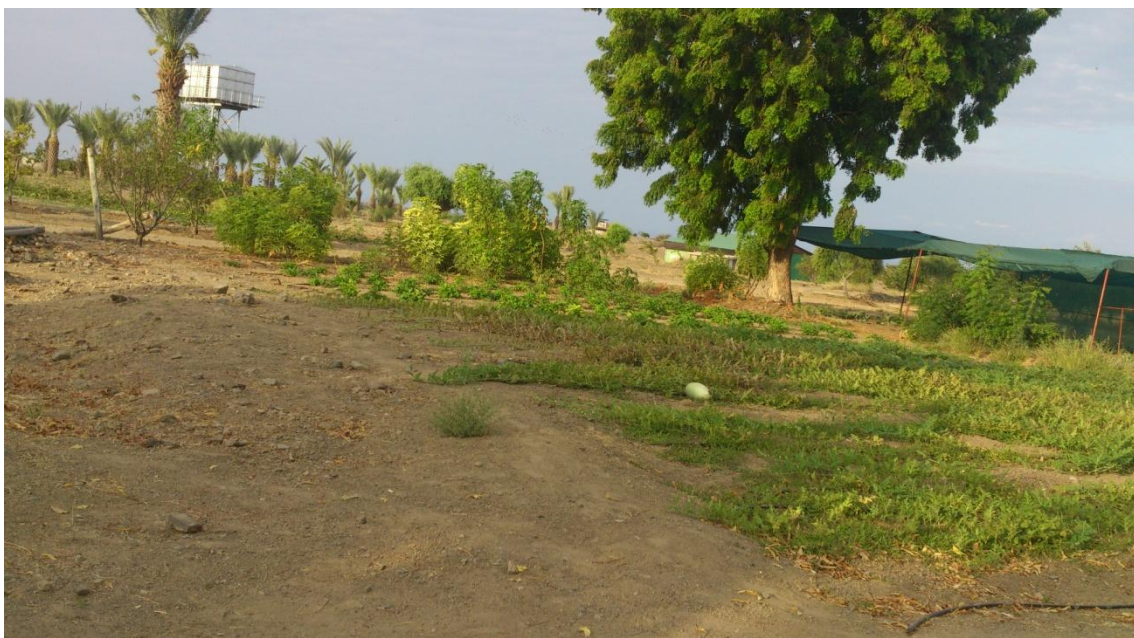
Imagen 3: Huertos creados para el proyecto de agricultura

Los proyectos de agricultura promovidos por la MCSPA están orientados a enseñar a cultivar la tierra para beneficiarse de sus frutos y a que la población Turkana aprenda a conservar los alimentos para disponer de comida a lo largo de todo el año. Para ello se realizan campañas de sensibilización y educación entre los habitantes de las orillas de los ríos y del lago sobre la importancia de los árboles en el medio ambiente y su conservación y cuidado. Asimismo, se enseña a cultivar huertos y se proporcionan semillas y esquejes de árboles frutales y herramientas.