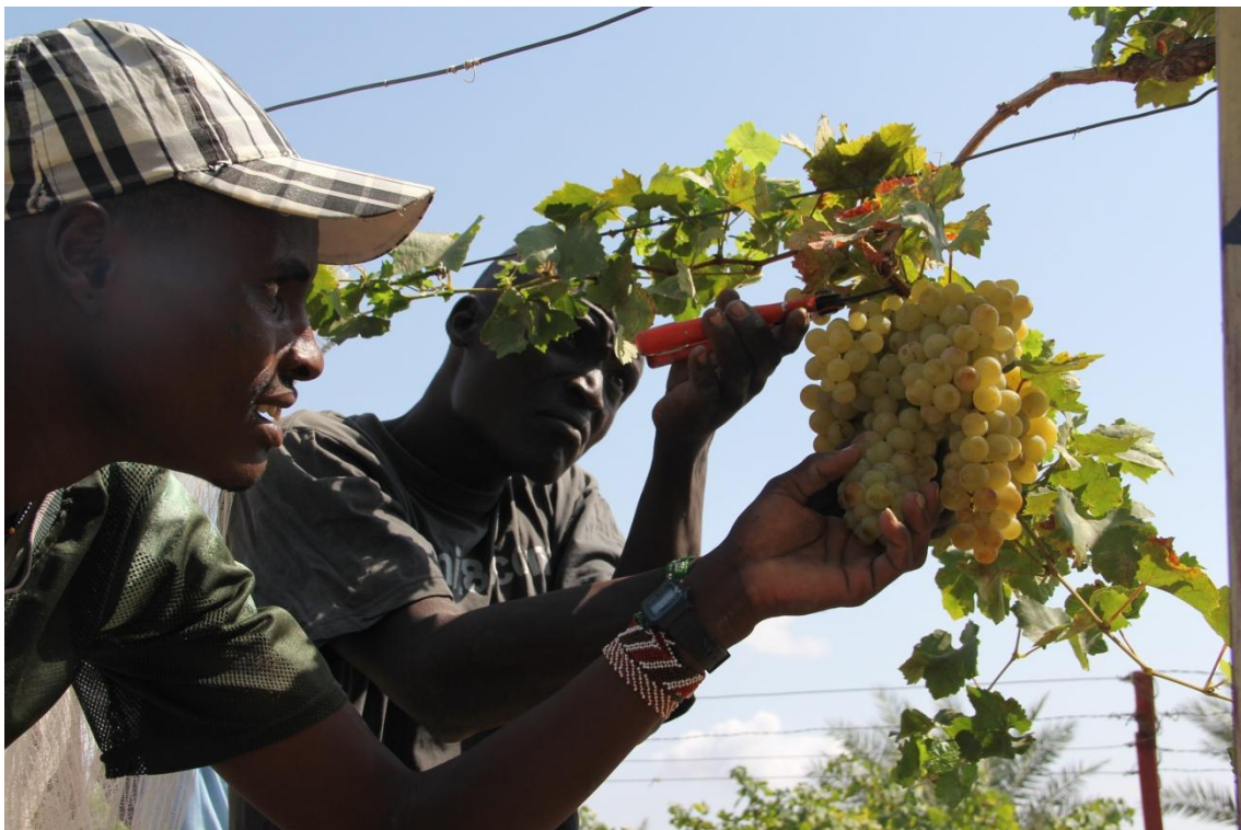
Imagen 4: Dos hombres Turkana trabajando en los viñedos

Una de las principales problemáticas de esta remota zona de Kenia es la producción de alimentos. En los últimos años, la MCSPA ha llevado a cabo una importante labor de experimentación de cultivos frutales en la zona. Los resultados son muy positivos ya que en el centro del proyecto, en la misión de Nariokotome, crecen numerosos tipos de árboles frutales como cocoteros, datileras, plataneros, mango, papayas, higueras, además de hortalizas como berenjenas, judías, tomates, pimientos, espinacas, sandías y melones, que crecen muy bien con el clima caluroso y el sol abundante. La propuesta de este proyecto es la implantación de pequeños huertos familiares, mediante la distribución de plántones producidos en Nariokotome, y la formación práctica de un grupo de mujeres en el cuidado de los frutales en su propia casa. El plan de acción consiste en la localización de las familias, la preparación del huerto y la plantación de árboles frutales, talleres teórico-prácticos de formación en cultivo de frutales, adquisición de herramientas, semillas y árboles, y visitas de seguimiento en los huertos.