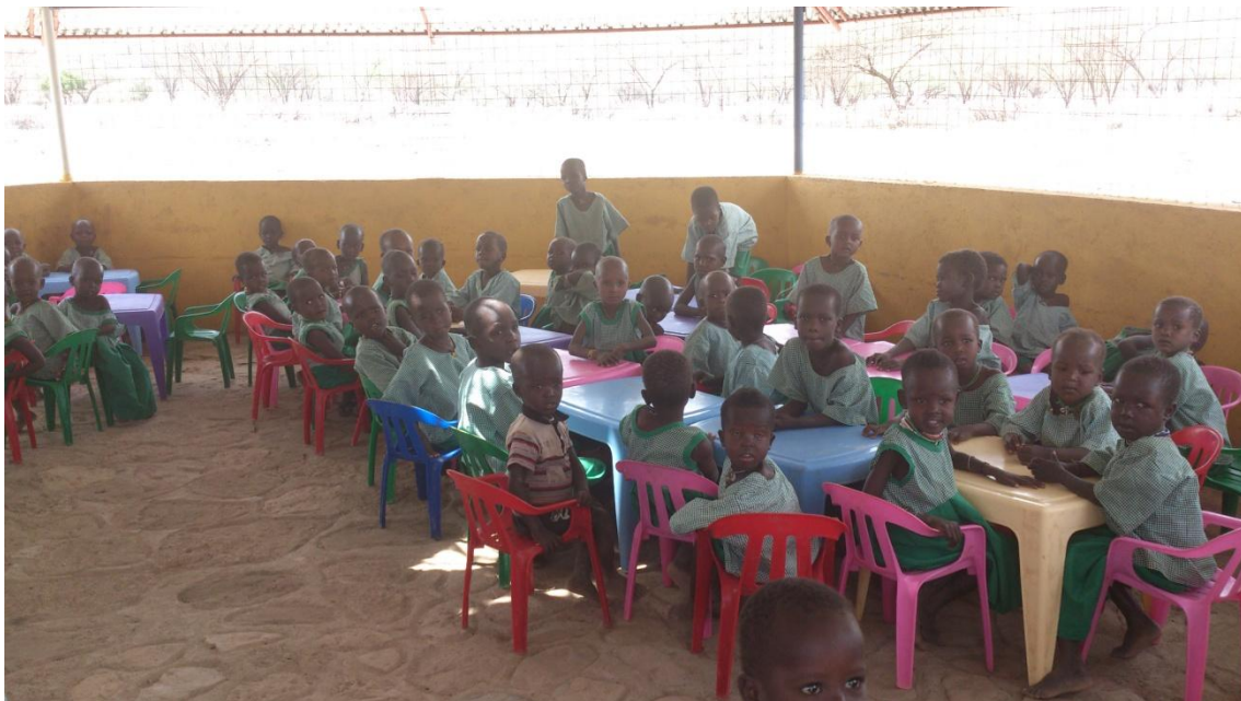
Imagen 5: Unidad Nutricional donde los niños reciben dos comidas diarias

Los proyectos de educación promovidos por la MCSPA se basan en la nutrición como foco de atracción para la población Turkana. La alimentación de la población Turkana depende totalmente de sus ganados, lo cual genera una situación de fragilidad ante las sequías en las cuales las familias pierden sus animales creándose así situaciones que ponen en riesgo su vida y, especialmente, la de la población más vulnerable: mujeres embarazadas y lactantes, ancianos y niños y niñas menores de 6 años. Para poder responder a esto, la MCSPA cuenta con varias Unidades Nutricionales en diferentes puntos de la región donde los niños pueden ser atendidos adecuadamente y donde las familias Turkana encuentran apoyo en el cuidado de sus hijos.