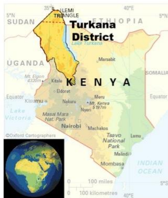
Imagen 1: Mapa de Turkana

Turkana es un vasto territorio árido y semiárido, con una densidad de población relativamente baja, una prestación de servicios relativamente escasa, unas infraestructuras de comunicación muy pobres y de baja seguridad. El distrito de Turkana cubre 77.000 kilómetros cuadrados en el extremo noroeste de Kenia, lindando con Etiopía, Sudán y Uganda, y delimitada al este por 200 km de costa del lago Turkana. Según un censo de 1999, se estima que el 75% de la población son nómadas y depende del pastoreo como su principal y única actividad económica (Saverio, 2001: 1). Lodwar es la principal ciudad del distrito, su capital y la sede del poder administrativo.