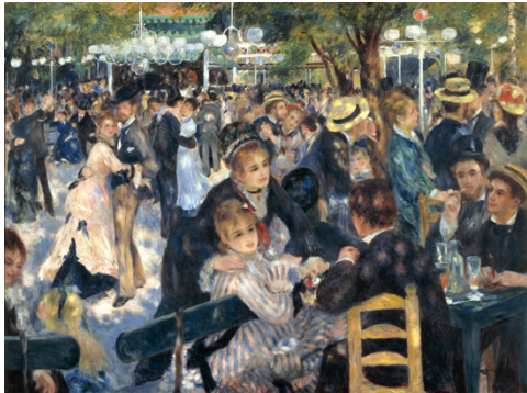
El Moulin de la Galette. Pierre-Auguste Renoir, 1876

sensorial de la multitud. Degas, más preocupado por el dibujo y la estructura del cuadro, centra su atención en el ballet, los cafés-concert o las carreras de caballos, experimentando con encuadres oblicuos y posturas fugaces que subrayan el movimiento y la artificialidad de los espacios modernos (Smith, 2006). Pissarro, por su parte, sistematiza los métodos impresionistas tanto en paisajes rurales como en vistas urbanas, mientras otros, como Sisley o más tarde Signac, exploran hasta el límite la descomposición del color en toques individuales.