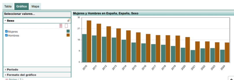
Figura 1. Evolución del abandono escolar temprano de la educación- formación por sexo en España (2010- 2024). Fuente: Instituto Nacional de Estadística (2024). https://ine.es/jaxiT3/Datos.htm?t=12543#_tabs-grafico