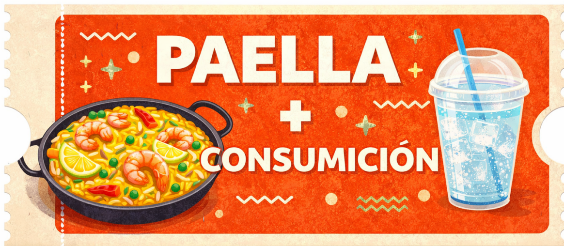
ANEXO II: Ticket de paella + consumición. Elaboración propia mediante ChatGPT (OpenAI, 2026).