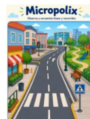
Sesión 12 – Imágenes líneas