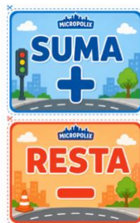
Sesión 7- Tarjetas sumas y restas