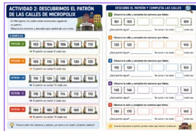
Sesión 5- Ficha patrón calles