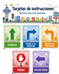
Sesión 11- Tarjetas instrucciones