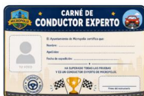
Sesión 1- Carné experto