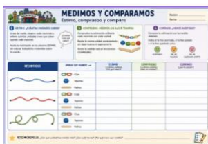
Sesión 10- Ficha estimo