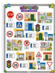
Sesión 1- Matemáticas cotidianas