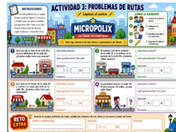
Sesión 7- Ficha problemas rutas