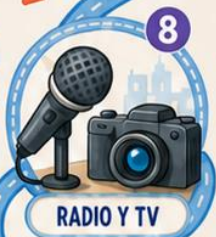
RADIO Y TV