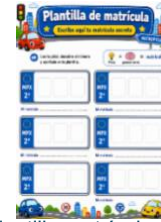
Sesión 3- Plantilla matrículas