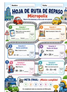
Sesión 9- Hoja de rutas