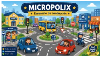
Sesión 1- Escenario