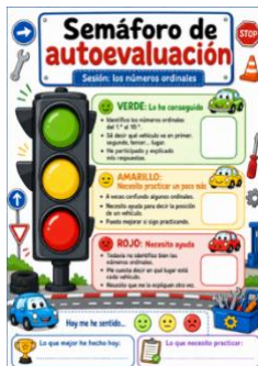
Sesión 4- Autoevaluación