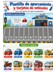
Sesión 4- Plantilla aparcamiento