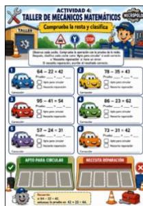
Sesión 8- Ficha taller mecánico