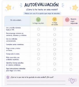
Sesión 15- Autoevaluación