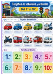
Sesión 4- Tarjeta n.º ordinales