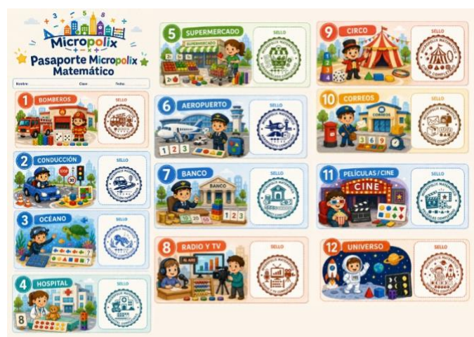
Figura 1. Pasaporte Micropolix

La programación se compone de 12 unidades , de las cuales, siguiendo los criterios establecidos para este trabajo, se desarrollará una con mayor profundidad.