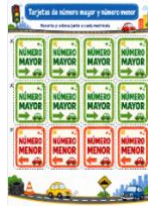
Sesión 2- Tarjetas mayor y menor