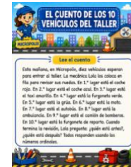
Sesión 4- Cuento