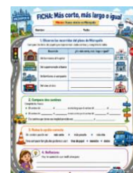
Sesión 1- Ficha corto, largo e igual