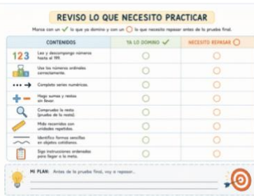
Sesión 14- Checklist