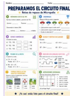
Sesión 14- Ficha preparación final Fuente: Elaboración propia CANVA