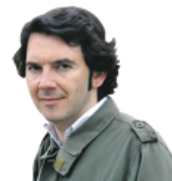
POR PABLO M. DÍEZ