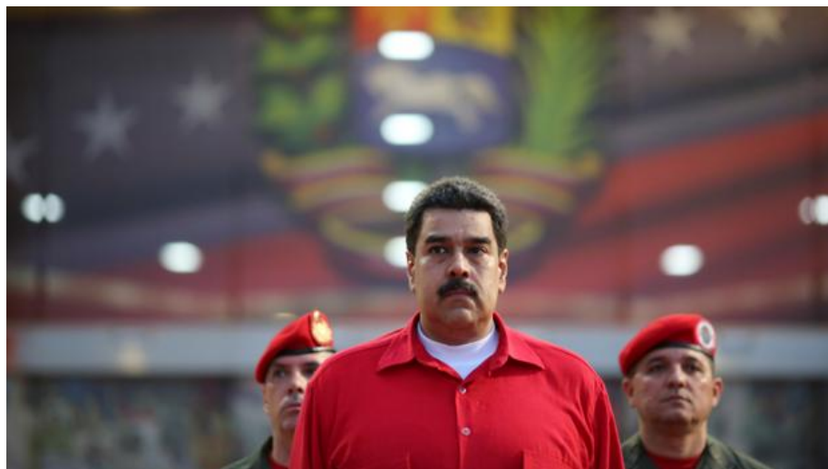
Nicollás Maduro

POR PEDRO RODRÍGUEZ / 25/10/2016 01:40h - Actualizado: 25/10/2016 11:54h.