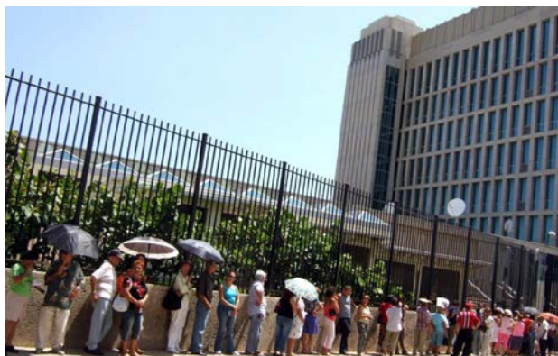
Cubanos haciendo cola frente a la Sección de Intereses de EEUU

Por otro lado, encontramos a las 4.000 personas y sus familiares que cada año se benefician de dicho programa especial para refugiados en el país. Esta garantía de 20.000 visas anuales es sólo para inmigrantes cubanos. Aunque la continua persistencia de cubanos que se lanzan al mar es objeto permanente de atención mediática, es a partir de 1994 cuando son más los inmigrantes que abandonan el país de forma legal frente a los 10.000 que llegan por vía marítima ilegalmente 15 .