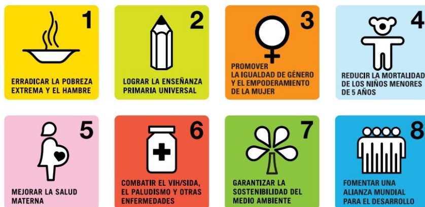
Figura 3: Los ODM