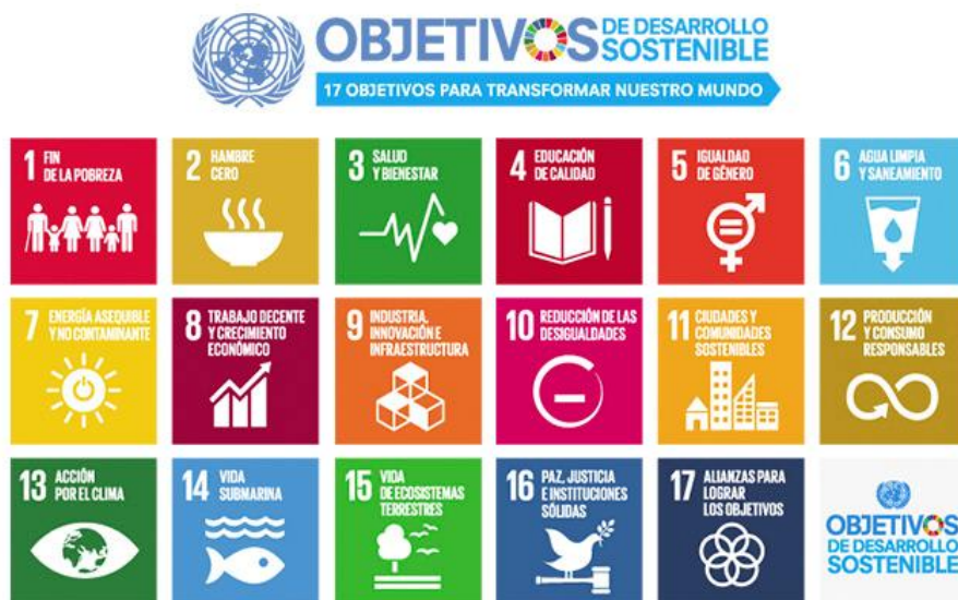
Figura 4: Los ODS