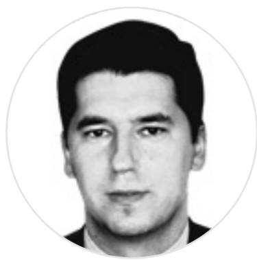
EDUARDO OSBORNE ARTÍCULOS