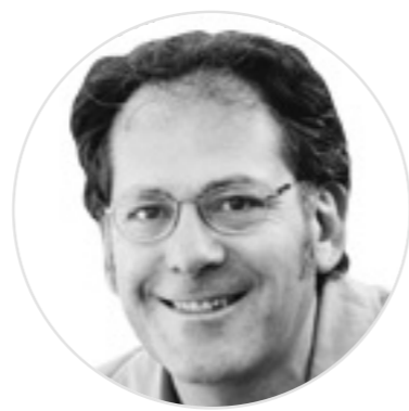
EDUARDO JORDÁ ARTÍCULOS