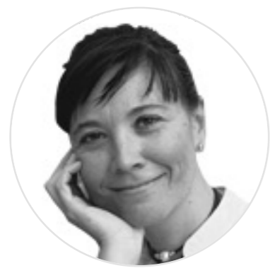
VICTORIA FERNÁNDEZ ARTÍCULOS